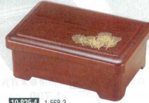
10-825-4 1-568-3 A D.X長手重 刷毛目若松内朱 ¥3,500 (19.6×13.9×8) 桐50