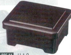
10-825-11 U-1-9 A (小) 象足丼重 溜内朱塗 ¥1,300 (14.2×12.5×7) 桐60