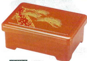
10-825-2 1-568-1 A D.X長手重 梨地赤松内朱 ¥3,250 (19.6×13.9×8) 桐50