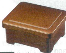
10-825-12 U-1-10 A (小) 象足丼重 梨地内朱塗 ¥1,180 (14.2×12.5×7) 桐60