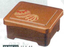
10-825-14 U-1-44 A (小) 象足丼重 梨地まり内朱塗 ¥1,450 (14.2×12.5×7) 桐60