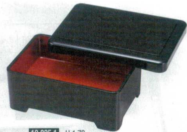
10-825-1 U-1-78 A D.X長手重 黒内朱 ¥2,850 (19.6×13.9×8) 桐50