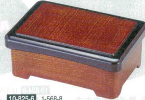
10-825-6 1-568-8 A D.X長手重 シルク布目内朱 エース塗 ¥4,800 (19.6×13.9×8) 桐50