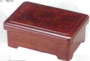
10-825-7 1-568-9 A D.X長手重 うず潮内朱 エース塗 ¥4,800 (19.6×13.9×8) 桐50