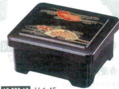
10-825-13 U-1-45 A (小) 象足丼重 茶パール扇面内朱塗 ¥1,450 (14.2×12.5×7) 桐60