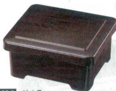
10-825-9 U-1-7 A (小) 象足丼重 新木目溜内朱塗 ¥1,300 (14.2×12.5×7) 桐60