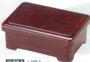
10-825-5 1-568-7 A D.X長手重 ケヤキ木目内朱 ¥4,450 (19.6×13.9×8) 桐50