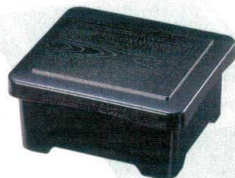
10-825-8 A (小) 象足丼重 U-1-6 新木目黒内朱塗 ¥1,200 (14.2×12.5×7) 桐60