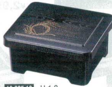
10-825-10 U-1-8 A (小) 象足丼重 新木目柳結び内朱塗 ¥1,400 (14.2×12.5×7) 桐60