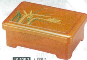
10-825-3 1-568-2 A D.X長手重 梨地ラン内朱 ¥3,400 (19.6×13.9×8) 桐50