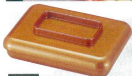
10-829-2 1-578-4 A 隅丸うなぎ平 梨地内朱 ¥1,800 (16.9×12.6×5.8) 梱80