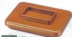
10-829-15 1-578-11 A (大)うなぎ平 金梨地内朱塗 ¥2,650 (18.9×14.1×6) 梱60