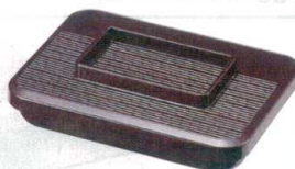
10-829-9 1-578-10 A 千筋うなぎ平 春慶内朱塗 ¥2,500 (18.5×13.7×5.7) 梱60