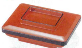
10-829-5 1-578-6 A うなぎ平 朱濁黒内朱塗 ¥1,650 (16.4×12.9×6.1) 梱80