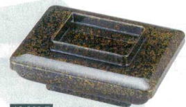
10-829-7 1-578-7 A うなぎ平 金津軽内朱塗 ¥2,600 (16.4×12.9×6.1) 梱80