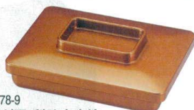
10-829-10 1-578-9 A 富士うなぎ平 梨地内朱塗 ¥2,750 (18.5×13.5×6.7) 梱60