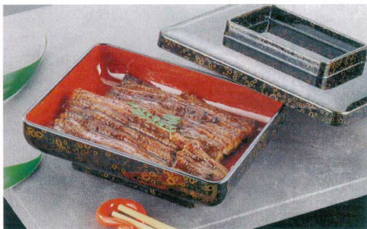
10-829-1 1-578-3 A 隅丸うなぎ平 溜天朱内朱 ¥1,650 (16.9×12.6×5.8) 梱80