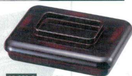
10-829-3 U-1-34 A 隅丸うなぎ平 曙内朱 ¥2,100 (16.9×12.6×5.8) 梱80