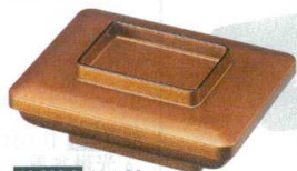
10-829-6 U-1-36 A うなぎ平 金梨地天黒内朱塗 ¥1,800 (16.4×12.9×6.1) 梱80