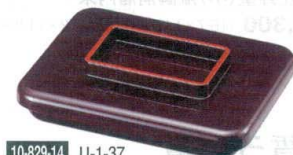
10-829-14 U-1-37 A (大)うなぎ平 新溜天朱内朱塗 ¥2,650 (18.9×14.1×6) 梱60