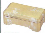
10-829-18 1-579-2 M 光月うなぎ平 (小) クリーム別甲内黒塗 ¥2,950 (14.9×8.7×5.5) 梱50