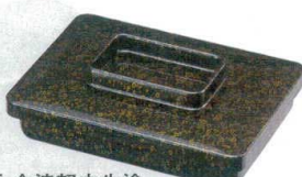
10-829-11 U-1-39 A 富士うなぎ平 金津軽内朱塗 ¥3,700 (18.5×13.5×6.7) 梱60