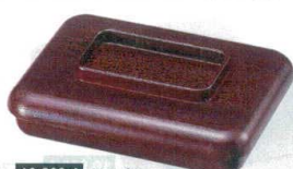
10-829-4 U-1-35 A 隅丸うなぎ平 溜刷毛目内朱 ¥2,750 (16.9×12.6×5.8) 梱80