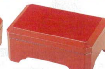
10-829-17 1-579-3 M 光月うなぎ平 (大) 後藤塗内朱塗 ¥3,400 (17.5×11.6×7.7) 梱50