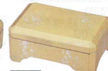
10-829-19 1-579-4 M 光月うなぎ平 (大) クリーム別甲内黒塗 ¥3,800 (17.5×11.6×7.7) 梱50