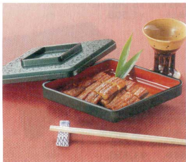
10-829-12 1-579-5 A 菱型うなぎ平 溜内朱塗 ¥2,500 (24×17.2×5.8) 梱60