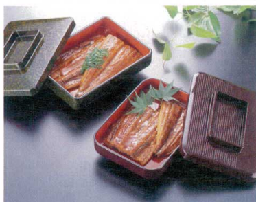
10-829-8 U-1-38 A 千筋うなぎ平 新溜内朱塗 ¥2,100 (18.5×13.7×5.7) 梱60