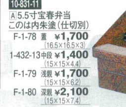
10-831-11 A | 5.5寸宝春弁当 このは内朱塗 (仕切別) F-1-78 蓋 ¥1,700 (16.5×16.5×3) 1-432-13 中段 ¥1,400 (15×15×4.4) F-1-79 浅観 ¥1,700 (15×15×6.2) F-1-80 深観 ¥2,100 (15×15×7.4)