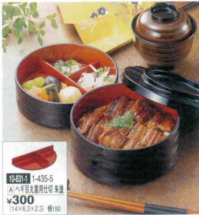
10-831-1 1-435-5 A | ヘギ目丸重用仕切 朱塗 ¥300 (14×6.3×2.3) 櫃150