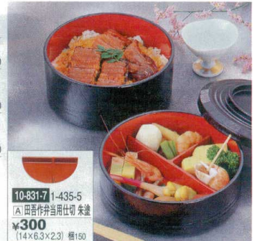
10-831-7 1-435-5 A | 田吾作弁当用仕切 朱塗 ¥300 (14×6.3×2.3) 櫃150