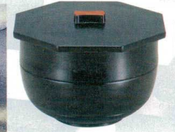
10-831-14 1-435-5 A | 5.5寸武蔵野椀用仕切 朱 ¥300