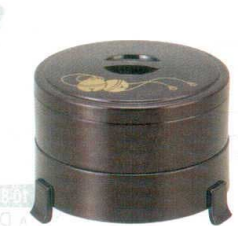
10-831-16 1-437-9 A | ミツ足弁当用仕切 朱塗 ¥500 (16.6φ×2.8) 櫃100