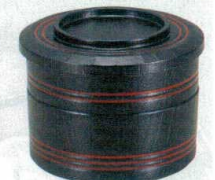
10-831-9 A | 田吾作弁当 黒朱ライン内朱塗 F-1-66 田吾作弁当用蓋 ¥850 (16.3φ×2.2) 櫃100 1-435-4 田吾作弁当用上段 (浅型オヤ) ¥1,050 (15.2φ×4.8) 櫃60 F-1-67 田吾作弁当用下段 (深型オヤ) ¥1,300 (15.2φ×6.7) 櫃60