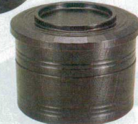
10-831-8 A | 田吾作弁当 溜内朱塗 F-1-64 田吾作弁当用蓋 ¥1,000 (16.3φ×2.2) 櫃100 1-435-2 田吾作弁当用上段 (浅型オヤ) ¥1,050 (15.2φ×4.8) 櫃60 F-1-65 田吾作弁当用下段 (深型オヤ) ¥1,250 (15.2φ×6.7) 櫃60