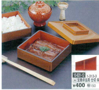
10-831-12 1-313-3 A | 宝春弁当用仕切 朱 ¥400 櫃150