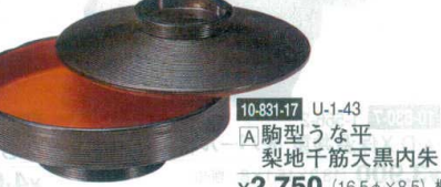
10-831-17 U-1-43 A | 駒型うなぎ 梨地千筋天黒内朱 ¥2,750 (16.5φ×8.5) 櫃60