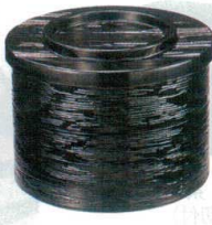
10-831-2 A | 5.5寸ヘギ目丸重 黒内朱塗 F-1-61 5.5寸ヘギ目丸重用 蓋 黒内朱 ¥950 (16φ×1.8) 櫃80 F-1-62 5.5寸ヘギ目丸重用 上段 (浅型オヤ) 黒内朱 ¥1,050 (15.2φ×4.7) 櫃60 F-1-63 5.5寸ヘギ目丸重用 下段 (深型オヤ) 黒内朱 ¥1,200 (15.2φ×6.8) 櫃40