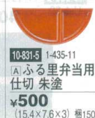
10-831-5 1-435-11 A | ふる里弁当用仕切 朱塗 ¥500 (15.4×7.6×3) 櫃150