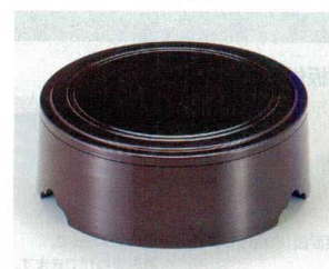
10-832-4 M7寸柳川 溜 1-587-5 本体 ¥1,950 (22.4φ×6.9) 櫃40 1-587-5A 蓋 ¥1,300 (21.5φ×1.8) 櫃60