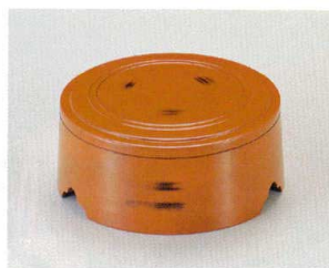
10-832-1 M6寸柳川 根来 1-587-1 本体 ¥1,150 (17.9φ×6.4) 櫃60 1-587-1A 蓋 ¥750 (17.2φ×1.8) 櫃80