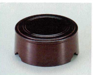
10-832-3 M6寸柳川 溜 1-587-2 本体 ¥1,500 (17.9φ×6.4) 櫃60 1-587-2A 蓋 ¥950 (17.2φ×1.8) 櫃80