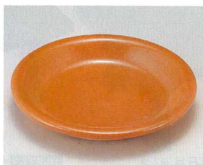
10-832-6 陶7寸柳川用 陶器皿 1-587-6 ¥1,550 (20.5φ×3.4) 櫃50