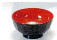
10-832-13 W-11-57 PET4寸亀甲汁椀 黒内朱 ¥470 (11.5φ×6・320ml) 櫃400