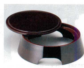
10-832-8 M7寸耐熱柳川 溜 U-1-62 本体 ¥1,540 (25.2φ×6.8) 櫃30 U-1-63 蓋 ¥1,120 (21.6φ×2.1) 櫃50