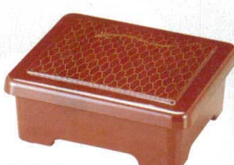
10-832-11 1-588-5 M耐熱メラミン丼重 網代 ¥3,700 (17×14.5×7) 櫃50 限定品