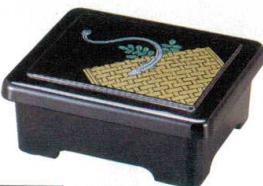
10-832-10 1-588-4 M耐熱メラミン丼重 山椒 ¥3,400 (17×14.5×7) 櫃50 限定品