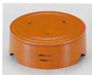
10-832-2 M7寸柳川 根来 1-587-4 本体 ¥1,500 (22.4φ×6.9) 櫃40 1-587-4A 蓋 ¥950 (21.5φ×1.8) 櫃60