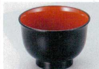
10-832-15 W-11-59 PET3.3寸美里汁椀 黒内朱 ¥500 (10φ×6.9・210ml) 櫃200