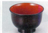
10-832-16 W-11-60 PET3.3寸美里汁椀 溜内朱 ¥610 (10φ×6.9・210ml) 櫃200