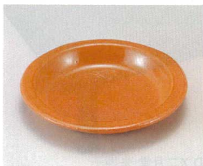
10-832-5 陶6寸柳川用 陶器皿 1-587-3 ¥1,450 (16.1φ×2.5) 櫃100