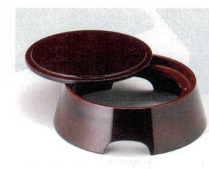
10-832-7 M6寸耐熱柳川 溜 U-1-60 本体 ¥1,360 (21.3φ×6.3) 櫃40 U-1-61 蓋 ¥950 (18φ×1.7) 櫃60