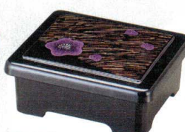
10-832-12 1-588-6 M耐熱メラミン丼重 梅松葉 ¥3,400 (17×14.5×7) 櫃50 限定品

※ 限定品 マークの商品は在庫を確認下さい。 ※ 10-832-7~16の商品は、掛率が異なりますのでご注意下さい。