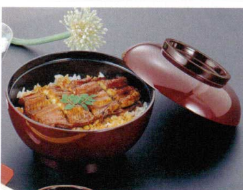
10-832-9 M耐熱親月井溜 (ST-3) 1-215-10A 蓋 ¥1,200 (15.7φ×7) 櫃60 1-215-10 身 ¥1,900 櫃60