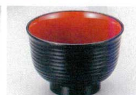
10-832-14 W-11-58 PET3.3寸美里荒筋汁椀 黒内朱 ¥500 (10φ×6.9・210ml) 櫃200