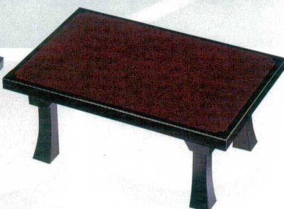
10-833-3 A D.X二月堂 朱姫子 1-14-1 底塗り無し ¥17,500 (72×48×31.2) 梱5 1-14-1A 底・足黒塗り ¥20,500