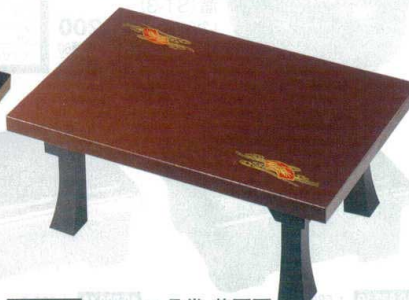
10-833-9 A D.X二月堂 茶扇面 A-1-11 底塗り無し ¥18,500 (72×48×31.2) 梱5 A-1-12 底・足黒塗り ¥21,500