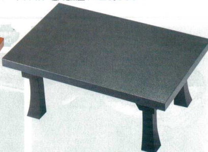
10-833-6 A D.X二月堂 紺石目 強化塗 A-1-7 底塗り無し ¥17,500 (72×48×31.2) 梱5 A-1-8 底・足黒塗り ¥20,500