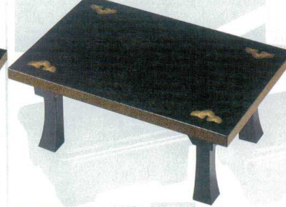
10-833-8 A D.X二月堂 黒地紋松葉 A-1-9 底塗り無し ¥19,000 (72×48×31.2) 梱5 A-1-10 底・足黒塗り ¥22,000