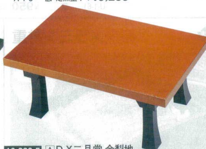
10-833-5 A D.X二月堂 金梨地 1-15-2 底塗り無し ¥16,200 (72×48×31.2) 梱5 1-15-2A 底・足黒塗り ¥19,200