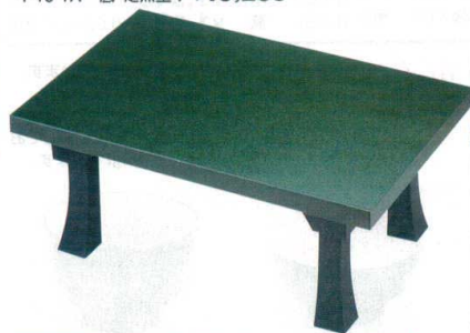
10-833-4 A D.X二月堂 グリーン石目 強化塗 1-15-3 底塗り無し ¥16,200 (72×48×31.2) 梱5 1-15-3A 底・足黒塗り ¥19,200