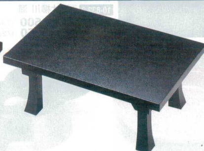
10-833-2 A D.X二月堂 黒石目 強化塗 A-1-5 底塗り無し ¥16,200 (72×48×31.2) 梱5 A-1-6 底・足黒塗り ¥19,200