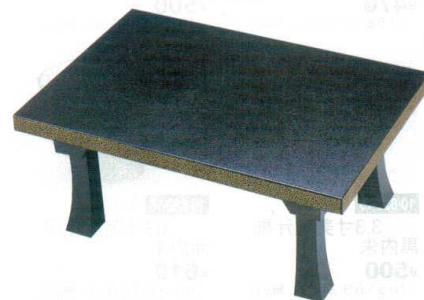
10-833-7 A D.X二月堂 黒石目地紋 強化塗 1-15-4 底塗り無し ¥18,500 (72×48×31.2) 梱5 1-15-4A 底・足黒塗り ¥21,500