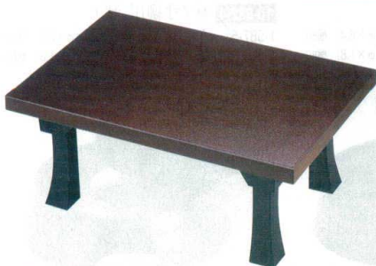
10-833-1 A D.X二月堂 茶石目 強化塗 1-15-1 底塗り無し ¥16,200 (72×48×31.2) 梱5 1-15-1A 底・足黒塗り ¥19,200