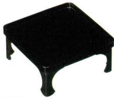
10-846-1 A] 尺0寸胴張仁の膳 黒 1-44-1 ¥3,450 (30.3×30.3×13.7) 櫃20