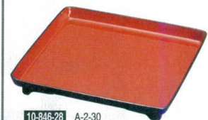
10-846-28 A-2-30 M] 尺2寸角仁の膳 黒内朱天黒 ¥3,700 (36.1×36.1×5) 櫃40