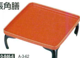
10-846-6 A-3-62 A] 新胴張角膳 朱天金 ¥5,000 (36.4×36.4×14.4) 櫃10