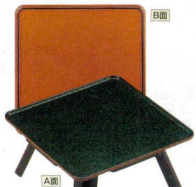
10-846-13 1-44-9 A] 尺1寸角両面膳 (両面タイプ) A面: グリーン石目 強化塗 B面: 金梨地天黒 セット ¥6,450 (33.3×33.3×16.5) 櫃40 盆のみ ¥3,950