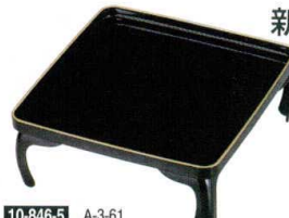
10-846-5 A-3-61 A] 新胴張角膳 黒天金 ¥5,000 (36.4×36.4×14.4) 櫃10