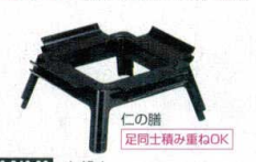
10-846-26 1-45-1 A] 尺0寸角膳用足 (1-73-18) (1-45-9) 用足 ¥2,350 (30×30×10.7) 櫃40