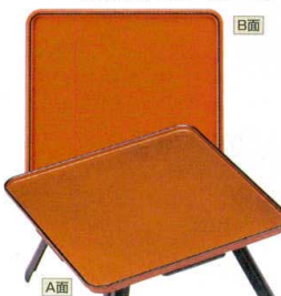
10-846-12 1-44-8 A] 徳川仁の膳 (両面タイプ) A面: 梨地 測朱 B面: 朱天黒 セット ¥7,000 (36.5×36.5×19.5) 櫃20 盆のみ ¥4,200