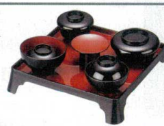
10-846-31 A-2-28 お喰初膳セット 黒内朱 (女の子用) ¥11,900 櫃10 A] 喰初膳 (27.7×27.7×5.8) A] 飯椀 (10φ×5.8) A] 汁椀 (9.3φ×7.2) A] 平椀 (11φ×5.6) A] つぼ椀 (8.5φ×6.4) M] 高椀 (8.4φ×5)