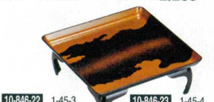
10-846-22 1-45-3 M] 尺0寸仁の膳 雲梨地 (ネジ足) ¥4,150 (30×30×8.5) 櫃40