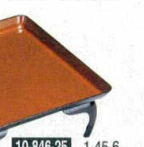
10-846-25 1-45-6 M] 尺2寸会席本膳 金梨地 (ネジ足) ¥4,650 (36.6×36.6×13) 櫃30