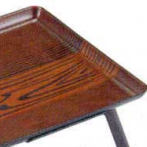
10-846-18 1-73-20 A] 尺2寸角膳 木目 セット ¥4,800 (36×36×15) 櫃20 盆のみ ¥2,200