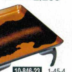
10-846-23 1-45-4 M] 尺2寸会席本膳 雲梨地 (ネジ足) ¥4,650 (36.6×36.6×13) 櫃30