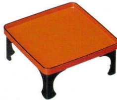
10-846-3 A] 尺0寸胴張仁の膳 朱天黒 1-44-2 ¥3,550 (30.3×30.3×13.7) 櫃20