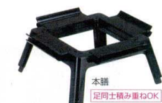
10-846-21 1-45-2 A] 尺2寸角膳用足 (1-73-20) (1-45-10) 用足 ¥2,600 (35.5×35.5×13.6) 櫃30