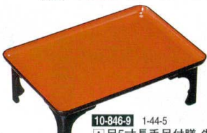
10-846-9 1-44-5 A] 尺5寸長手足付膳 朱天黒 ¥5,600 (45.6×31.9×15.3) 櫃5