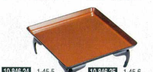
10-846-24 1-45-5 M] 尺0寸仁の膳 金梨地 (ネジ足) ¥4,150 (30×30×8.5) 櫃40