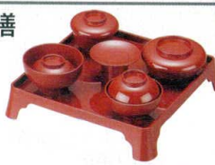
10-846-30 A-2-27 お喰初膳セット 総朱 (男の子用) ¥11,900 櫃10 A] 喰初膳 (27.7×27.7×5.8) A] 飯椀 (10φ×5.8) A] 汁椀 (9.3φ×7.2) A] 平椀 (11φ×5.6) A] つぼ椀 (8.5φ×6.4) M] 高椀 (8.4φ×5)