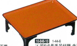
10-846-10 1-44-6 A] 尺6寸長手足付膳 朱天黒 ¥5,800 (48.3×36.2×15.3) 櫃5