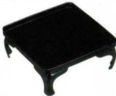
10-846-7 A] 尺0寸胴張仁の膳 黒 (猫足型) A-1-3 ¥3,450 (30.3×30.3×13.7) 櫃20