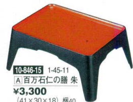
10-846-15 1-45-11 A] 百万石仁の膳 朱 ¥3,300 (41×30×18) 櫃40