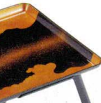
10-846-20 1-45-10 A] 尺2寸角膳 雲梨地 セット ¥4,600 (36×36×15) 櫃20 盆のみ ¥2,000