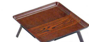
10-846-17 1-73-18 A] 尺0寸角膳 木目 セット ¥4,050 (30×30×12) 櫃30 盆のみ ¥1,700