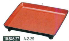
10-846-27 A-2-29 M] 尺0寸角仁の膳 黒内朱天黒 ¥3,150 (30×30×4.6) 櫃40