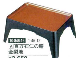
10-846-16 1-45-12 A] 百万石仁の膳 金梨地 ¥3,650 (41×30×18) 櫃40