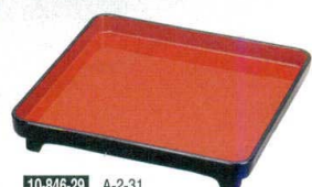
10-846-29 A-2-31 M] 尺2寸角厚型仁の膳 黒内朱天黒 ¥4,050 (36.1×36.1×6.3) 櫃30