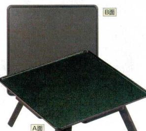
10-846-14 1-44-10 A] 尺5寸角両面膳 (両面タイプ) A面: グリーン石目 強化塗 B面: グレー石目 強化塗 セット ¥9,800 (45.5×45.5×22.5) 櫃20 盆のみ ¥6,000