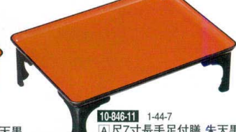
10-846-11 1-44-7 A] 尺7寸長手足付膳 朱天黒 ¥6,200 (51.4×36.3×15.4) 櫃5