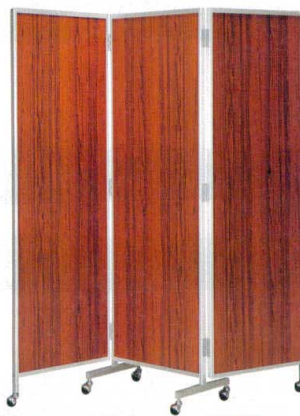
10-890-11 三ツ折衝立 ローズ 直送 A-2-93 低型 ¥120,000 (W180×D40×H172) A-2-94 高型 ¥135,000 (W180×D40×H200)