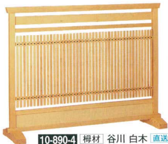
10-890-4 榿材 谷川 白木 直送 1-904-8 ¥70,000 (W120×D28×H90)