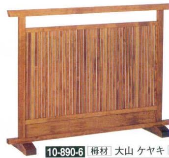
10-890-6 榿材 大山 ケヤキ 直送 1-905-3 ¥60,000 (W120×D28×H90)