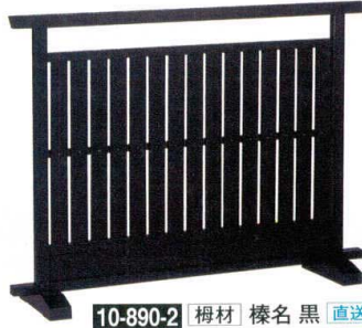
10-890-2 榿材 樺名 黒 直送 1-904-6 ¥67,000 (W120×D28×H90)