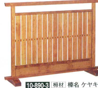
10-890-3 榿材 樺名 ケヤキ 直送 1-904-7 ¥67,000 (W120×D28×H90)