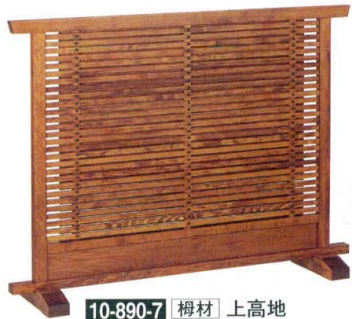
10-890-7 榿材 上高地 ケヤキ 直送 1-905-6 ¥68,000 (W120×D28×H90)