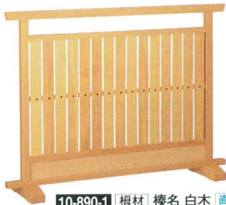
10-890-1 榿材 樺名 白木 直送 1-904-5 ¥67,000 (W120×D28×H90)