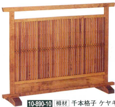
10-890-10 榿材 千本格子 ケヤキ 直送 1-904-4 ¥60,000 (W120×D28×H90)