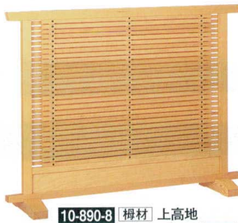
10-890-8 榿材 上高地 白木スタレ型 直送 1-904-9 ¥68,000 (W120×D28×H90)