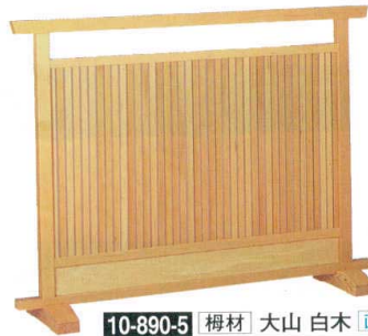
10-890-5 榿材 大山 白木 直送 1-905-2 ¥60,000 (W120×D28×H90)