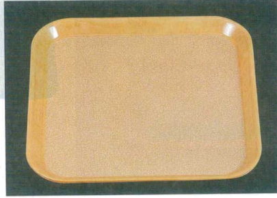
10-93-8 B-8-91 FRP (SS-33N) 耐熱 角トレー ブラウンモスト ノンスリップ加工 WS ¥2,850 (33×33×2) 梱40