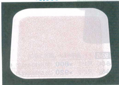
10-93-7 B-8-90 FRP (SS-33N) 耐熱 角トレー ピンクモスト ノンスリップ加工 WS ¥2,850 (33×33×2) 梱40