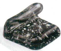
10-947-4 H-41-13 AC 巻物型箸置 銀河 ¥800 (4.1×3.1×2.6)