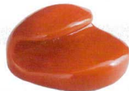
10-947-5 H-59-15 A 巻扇形箸置 朱 ¥350 (4×3.7×2.4)