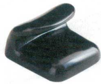
10-947-1 H-59-16 A 巻物型箸置 黒 ¥350 (4.1×3.1×2.6)