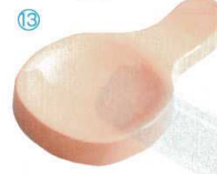
10-947-12 H-59-21 AC ツイン箸置 白 ¥500 (9×5.3×1.2)