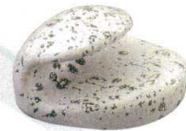
10-947-8 H-41-8 A 巻扇形箸置 石目塗 ¥700 (4×3.7×2.4)