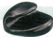
10-947-6 H-41-6 A 巻扇形箸置 黒乾漆 ¥600 (4×3.7×2.4)