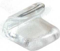
10-947-2 H-59-17 AC 巻物型箸置 透明 ¥400 (4.1×3.1×2.6)