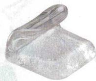
10-947-3 H-41-12 AC 巻物型箸置 ラメ ¥600 (4.1×3.1×2.6)