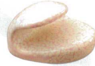
10-947-9 H-41-9 A 巻扇形箸置 桜志野 ¥700 (4×3.7×2.4)