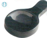
10-947-10 H-44-82 AC ツイン箸置 朱 ¥380 (9×5.3×1.2)