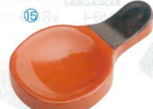
10-947-14 H-59-24 A ツイン箸置 新溜 ¥450 (9×5.3×1.2)