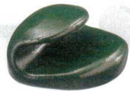
10-947-7 H-41-7 A 巻扇形箸置 グリーン石目 ¥600 (4×3.7×2.4)