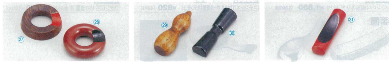
10-949-27 1-786-31 困丸型箸置き スリ漆 ¥400 (4.8φ×1) 梱500 10-949-28 1-786-32 困丸型箸置き 朱/黒 ¥400 (4.9φ×1.5) 梱500 10-949-29 1-786-33 困ひょうたん型箸置き スリ漆 ¥400 (5.9×2×2) 梱500 10-949-30 1-786-34 困杵型箸置き 黒 ¥400 (6×1.7×1.3) 梱500 10-949-31 1-786-37 困枕型箸置き 朱/黒 ¥600 (6.1×1.6×1.5) 梱500