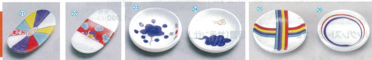
10-949-21 H-1-97 陶小判箸置き 紙風船 ¥270 (5.7×3.1×1) 梱1,080 10-949-22 H-1-99 陶小判箸置き 赤椿 ¥270 (5.7×3.1×1) 梱1,080 10-949-23 H-1-93 陶染付箸置き 花 ¥270 (6.8φ×1.5) 梱384 10-949-24 H-1-94 陶染付箸置き 雲 ¥270 (6.8φ×1.5) 梱384 10-949-25 H-1-95 陶丸型箸置き 糸巻 ¥270 (6.8φ×1.5) 梱384 10-949-26 H-1-96 陶丸型箸置き 二色ライン ¥270 (6.8φ×1.5) 梱384