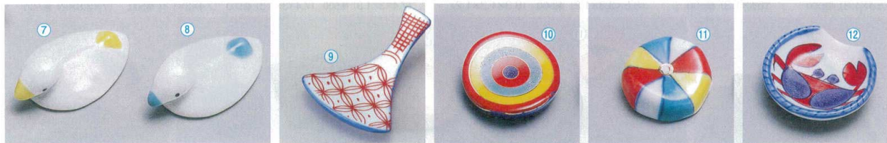
10-949-7 H-1-75 陶あひる箸置き 黄 ¥190 (4×2.4×1.5) 梱1,920 10-949-8 H-1-76 陶あひる箸置き 青 ¥190 (4×2.4×1.5) 梱1,920 10-949-9 H-1-78 陶いちよう箸置き 七宝 ¥240 (4.2×2.4×1.5) 梱2,880 10-949-10 H-1-79 陶丸箸置き 的 ¥240 (3.4×3.3×0.8) 梱1,200 10-949-11 H-1-82 陶玉箸置き 紙風船 ¥240 (3.2×3.1×1.4) 梱1,200 10-949-12 H-1-81 陶半月箸置き 赤カニ ¥240 (4×3.7×1) 梱1,600