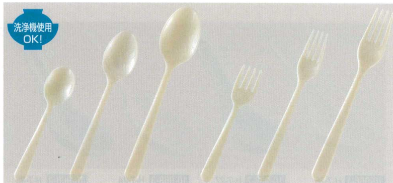
10-969-1 H-77-15 M (大)レンゲ 白 ¥1,100 (21×5.4) 梱300