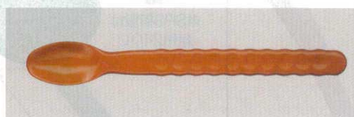
10-969-5 J-100-58 WSS-10 丸スプーン オレンジ ¥320 (19.7)