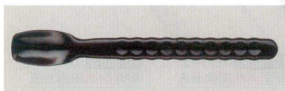
10-969-7 J-100-60 WSS-11 角スプーン ブラウン ¥320 (19.7)