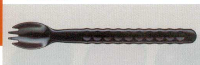
10-969-10 J-100-63 WSS-12 先割れスプーン ブラウン ¥320 (19.7)