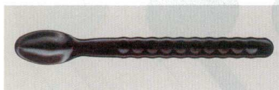
10-969-4 J-100-57 WSS-10 丸スプーン ブラウン ¥320 (19.7)