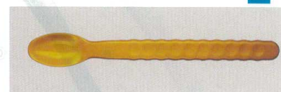
10-969-6 J-100-59 WSS-10 丸スプーン イエロー ¥320 (19.7)