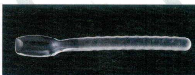
10-969-14 H-70-57 AC/WSS-11 角スプーン透明 ¥320 (19.7)