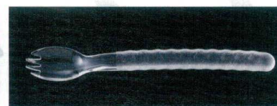
10-969-15 H-70-58 AC/WSS-12 先割れスプーン透明 ¥320 (19.7)