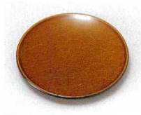
10-980-7 H-8-88 M 4.5寸青海銘々皿 漆調春慶塗 ¥1,350 (13.8φ×1.7) 櫃200