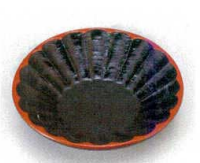
10-980-38 1-762-8 A 菊型茶托 黒天朱 ¥750 (12φ×2.3) 櫃200