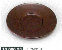
10-980-22 1-760-4 A 平茶托 溜 ¥650 (11.5φ×1) 櫃200