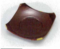
10-980-28 1-760-10 A 隅切茶托 溜測金 ¥700 (9.5×9.5×2.2) 櫃200