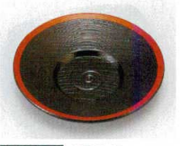
10-980-32 1-760-15 A 4寸乱筋茶托 黒朱ライン ¥650 (12.2φ×1.9) 櫃200