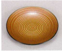
10-980-2 H-93-55 A 5寸菓子皿 金渦 ¥1,250 (14.9φ×1.5) 櫃200