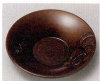
10-980-33 H-9-15 M 梅彫茶托 枳 ¥900 (12φ×2.2) 櫃200