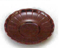
10-980-37 1-762-7 M 菊花茶托 溜 ¥900 (12.1φ×2.1) 櫃200