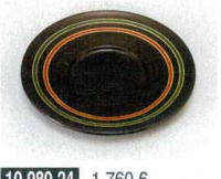
10-980-24 1-760-6 A 平茶托 ライン ¥900 (11.5φ×1) 櫃200