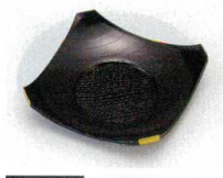
10-980-26 1-760-8 A 隅切茶托 黒測金 ¥580 (9.5×9.5×2.2) 櫃200