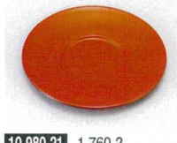
10-980-21 1-760-2 A 平茶托 朱 ¥550 (11.5φ×1) 櫃200