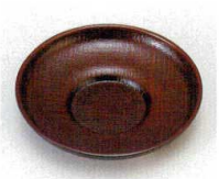
10-980-17 1-760-13 M 4寸だるま茶托 溜布目 ¥1,000 (12φ×2) 櫃200