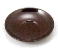
10-980-16 H-45-73 M 4寸だるま茶托 溜 ¥1,000 (12φ×2) 櫃200