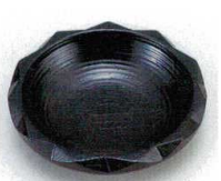
10-980-36 1-762-4 A 4寸D.X亀甲茶托 黒 ¥650 (12φ×2.8) 櫃200