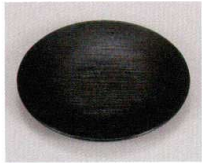
10-980-1 H-93-54 A 5寸菓子皿 黒刷毛目 ¥900 (14.9φ×1.5) 櫃200