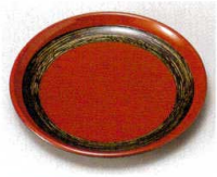
10-980-5 H-8-96 A お好み銘々皿 赤に金かすり ¥900 (16φ×2) 櫃200