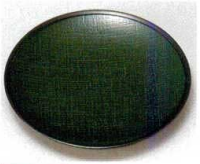
10-980-12 H-8-95 M 5.5寸布目銘々皿 グリーンかすり測黒 ¥1,430 (16.5φ×2) 櫃200