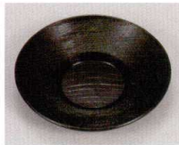
10-980-14 H-93-56 A 3.6寸ケヤキ千筋木目 茶托 新溜 ¥500 (10.3φ×1.6) 櫃200 10-980-15 H-93-57 A 4寸ケヤキ千筋木目 茶托 新溜 ¥550 (11.7φ×1.8) 櫃200