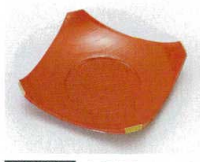
10-980-27 1-760-9 A 隅切茶托 朱測金 ¥600 (9.5×9.5×2.2) 櫃200