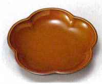
10-980-9 H-8-90 M 新梅型菓子皿 漆調春慶塗 ¥1,400 (15φ×2.6) 櫃200