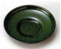
10-980-18 H-8-98 M 4寸だるま茶托 グリーンかすり布目 ¥1,000 (12φ×2) 櫃200