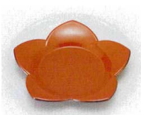
10-980-35 1-762-6 A きぎょう茶托 朱 ¥500 (11.5×11.2×1.7) 櫃200