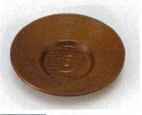
10-980-30 1-760-11 A 3.8寸乱筋茶托 溜 ¥530 (11.5φ×1.9) 櫃200 10-980-31 1-760-14 A 4寸乱筋茶托 溜 ¥550 (12.2φ×1.9) 櫃200