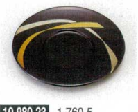
10-980-23 1-760-5 A 平茶托 黒花帯 1,150 (11.5φ×1) 櫃200