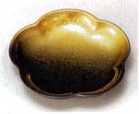
10-980-10 H-8-91 M 新梅型菓子皿 パール色紙金箔 ¥1,700 (15φ×2.6) 櫃200