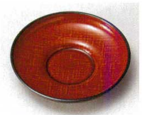
10-980-19 H-8-99 M 4寸だるま茶托 朱かすり布目 ¥1,000 (12φ×2) 櫃200