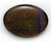
10-980-6 1-759-11 限定品 木5寸銘々皿 沈金牡丹漆塗 ¥1,300 (15.1φ×1.8) 櫃200