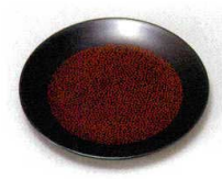
10-980-13 H-8-93 M 5寸春秋銘々皿 姫子塗 ¥1,900 (15.2φ×1.5) 櫃200