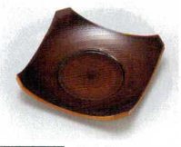
10-980-29 H-8-50 A 隅切茶托 枳 ¥750 (9.5×9.5×2.2) 櫃200