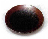
10-980-8 H-8-89 M 4.5寸青海銘々皿 溜春慶 ¥1,350 (13.8φ×1.7) 櫃200