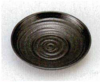
10-980-3 1-759-12 M 象こく菓子皿 黒 ¥850 (13.7φ×2.1) 櫃200