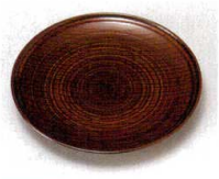
10-980-4 H-8-97 A 木目銘々皿 枳 ¥850 (15φ×2.1) 櫃200