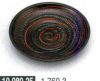
10-980-25 1-760-3 A 4寸木彫り茶托 古代暁 ¥600 (12φ×1.9) 櫃200