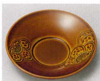
10-980-34 H-9-16 M 梅彫茶托 漆調春慶塗 ¥1,000 (12φ×2.2) 櫃200