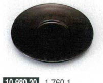
10-980-20 1-760-1 A 平茶托 黒 ¥550 (11.5φ×1) 櫃200