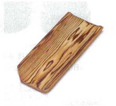
10-986-23 1-766-11 木焼杉おしぼり入れ ¥600 (17×7×0.9) 櫃200