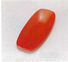
10-986-1 1-765-11 M 布袋おしぼり入れ 朱 ¥1,100 (18.6×8.2×1.2) 櫃200