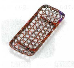
10-986-20 1-766-4 限定品 竹長角網目ランタイ おしぼり入れ ¥500 (17.3×7.2×2.1) 櫃200