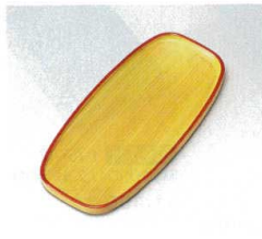
10-986-7 H-10-22 A 小判型おしぼり入れ 白木天ウルミ ¥1,050 (17.1×8.1×1.3) 櫃200