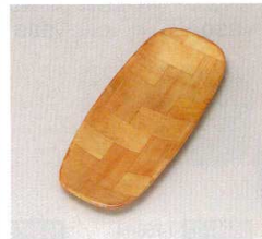
10-986-17 H-8-13 限定品 木小判型おしぼり入れ ¥450 (18.2×8×1.4) 櫃200