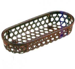
10-986-15 1-620-8 A 8.5寸長手愛染かご おしぼり入れ 溜 (3人用) ¥1,200 (24.8×11×4.4) 櫃100