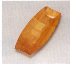
10-986-18 H-8-12 限定品 木舟型おしぼり入れ ¥500 (19.9×8.9×2) 櫃200