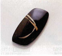
10-986-3 1-765-13 M 布袋おしぼり入れ 黒花帯 ¥2,100 (18.6×8.2×1.2) 櫃200