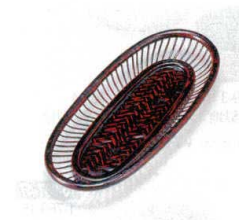
10-986-21 1-766-7 限定品 竹小判かごめランタイ おしぼり入れ ¥1,200 (18×8×2.5) 櫃200