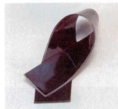
10-986-11 1-765-18 A 結びおしぼり入れ 溜 ¥1,400 (22.3×9.4×5.3) 櫃200