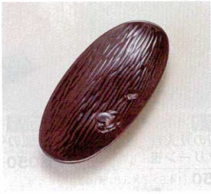
10-986-9 1-765-17 M 梅おしぼり入れ 溜 ¥1,200 (20.3×8.7×2.1) 櫃200