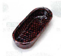
10-986-22 1-766-8 限定品 竹深竹目ランタイ おしぼり入れ ¥1,200 (17.5×8×3.4) 櫃200