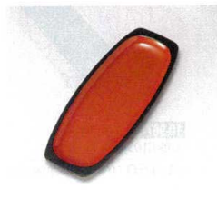
10-986-6 H-10-21 A 新胴張おしぼり入れ 朱天黒 ¥980 (19.7×7.8×1.2) 櫃200