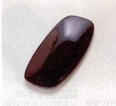
10-986-2 1-765-12 M 布袋おしぼり入れ 溜 ¥1,350 (18.6×8.2×1.2) 櫃200