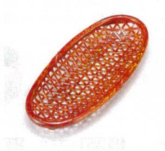
10-986-19 1-766-2 限定品 竹小判網目春慶ランタイ おしぼり入れ ¥700 (18×8×2.3) 櫃200