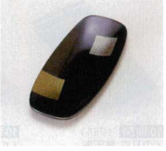
10-986-5 1-765-15 M 布袋おしぼり入れ 黒色紙 ¥1,950 (18.6×8.2×1.2) 櫃200