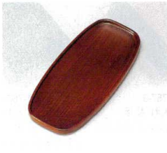
10-986-8 H-10-23 A 小判型おしぼり入れ チーク塗 ¥1,300 (17.1×8.1×1.3) 櫃200