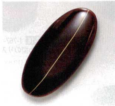
10-986-13 H-9-29 M 小判おしぼり入れ 溜 金ライン ¥1,600 (20.3×8.5×2.2) 櫃200