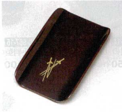
10-986-14 H-9-31 M (大) 富士型おしぼり入れ 溜 松葉 ¥1,850 (18×10.8×2) 櫃200