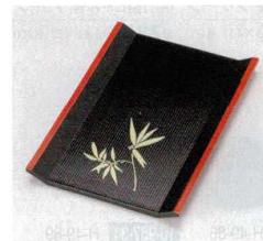
10-986-16 1-765-20 A (大) おしぼり入れ 笹 (3~5人用) ¥1,000 (19.2×13.3×1.5) 櫃200