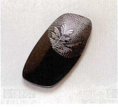
10-986-4 1-765-14 M 布袋おしぼり入れ 黒武蔵野 ¥1,850 (18.6×8.2×1.2) 櫃200