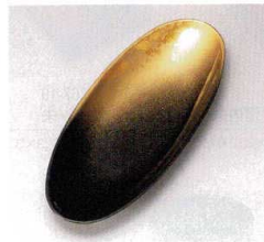
10-986-12 H-9-28 M 小判おしぼり入れ パール色紙金箔 ¥1,600 (20.3×8.5×2.2) 櫃200