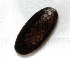
10-986-10 H-9-24 M 網目おしぼり入れ 枳 ¥1,650 (20.3×8.6×2.2) 櫃200