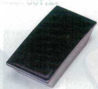
10-987-10 1-767-11 A舟型のり入れ マルーン天朱 ¥1,050 (14.5×7×3.8) 櫃100