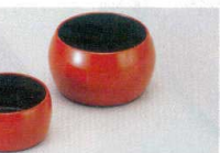
10-987-27 1-768-9 M竹型酒袴 黒帯朱 ¥700 (7.7φ×4.1) 櫃200