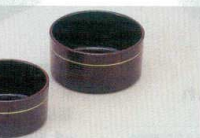
10-987-21 1-768-3 A切立酒袴 溜金ライン ¥800 (7.6φ×4) 櫃200