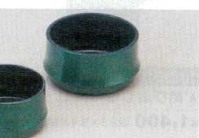
10-987-24 1-768-6 A切立ビール袴 金色紙 ¥850 (8.8φ×4.3) 櫃200