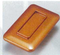
10-987-3 1-578-2 Aのり入れ 梨地 ¥1,000 (13.8×8.6×4.4) 櫃100