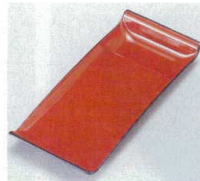
10-987-2 1-767-2 Aのり皿 朱天黒 ¥850 (17.8×8×2.2) 櫃100