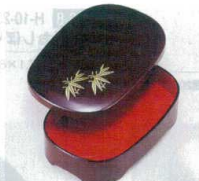
10-987-16 1-767-18 Mくつわ型のり入れ 溜内朱笹 ¥1,650 (13.6×7.2×3.5) 櫃100