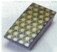
10-987-7 1-767-7 A舟型のり入れ 菊詰 ¥1,200 (14.5×7×3.8) 櫃100