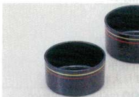
10-987-19 1-768-1 A切立酒袴 ライン ¥700 (7.6φ×4) 櫃200