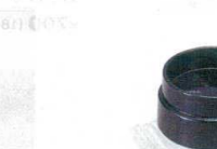
10-987-33 H-49-86 Mまゆ型酒袴 溜 ¥750 (7.3φ×3.4) 櫃200