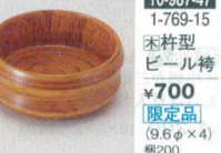
10-987-41 1-769-15 M布袋型ビール袴 梨地 ¥700 限定品 (9.5φ×3.5) 櫃200