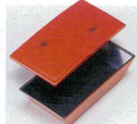
10-987-6 1-767-6 A舟型のり入れ 根来 ¥1,150 (14.5×7×3.8) 櫃100