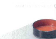
10-987-31 1-768-13 Mまゆ型酒袴 黒刷毛目 ¥700 (7.3φ×3.4) 櫃200