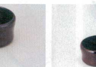
10-987-29 1-768-11 Mタイコ酒袴 朱 ¥730 (7.5φ×3) 櫃200