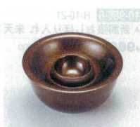
10-987-18 1-767-20 M玉子立て 梨地 ¥1,200 (11.3φ×5.3) 櫃100