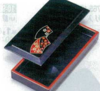
10-987-14 1-767-15 A徳川のり入れ 黒扇面 ¥1,350 (16×7.5×2.8) 櫃100