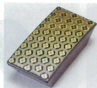
10-987-5 1-767-10 A舟型のり入れ 溜亀甲 ¥1,450 (14.5×7×3.8) 櫃100