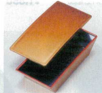
10-987-9 1-767-9 A舟型のり入れ 梨地 ¥1,050 (14.5×7×3.8) 櫃100