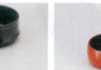
10-987-26 1-768-8 A竹型ビール袴 グリーン ¥775 (9.1φ×4.8) 櫃200