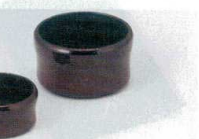
10-987-30 1-768-12 Mタイコビール袴 朱 ¥950 (8.5φ×3.6) 櫃200