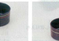
10-987-20 1-768-2 A切立ビール袴 ライン ¥800 (8.8φ×4.3) 櫃200