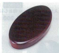
10-987-15 1-767-17 M小判型のり入れ 溜内朱 ¥1,400 (15.2×8.4×2.5) 櫃100