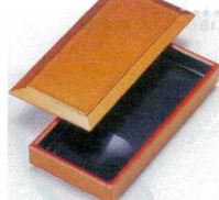
10-987-12 1-767-13 A徳川のり入れ 梨地 ¥1,150 (16×7.5×2.8) 櫃100