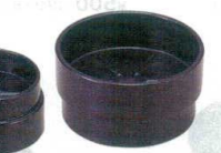
10-987-34 H-49-89 Mまゆ型ビール袴 溜 ¥950 (9.6φ×5.3) 櫃200