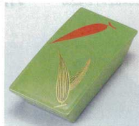
10-987-8 1-767-8 A舟型のり入れ モスグリーン笹 ¥1,250 (14.5×7×3.8) 櫃100