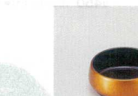
10-987-35 O-3-88 A口コビール袴 黒内朱 ¥400 (9φ×2.7) 櫃200