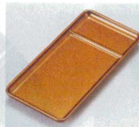
10-987-4 1-767-4 M平型のり皿 (タレ付) 梨地 ¥830 (18.2×8.9×1.8) 櫃100