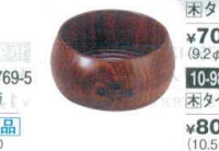
10-987-38 1-769-1 A酒・ビール兼用袴 黒刷毛目 ¥800 (9.4φ×4.9) 櫃200