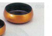
10-987-36 O-3-87 A口コ目ビール袴 朱内黒 ¥400 (9φ×2.7) 櫃200