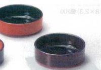
10-987-32 1-768-14 Mまゆ型ビール袴 黒刷毛目 ¥950 (9.6φ×5.3) 櫃200