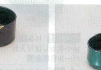
10-987-23 1-768-5 A切立酒袴 金色紙 ¥800 (7.6φ×4) 櫃200