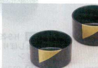
10-987-22 1-768-4 A切立ビール袴 溜金ライン ¥850 (8.8φ×4.3) 櫃200