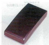
10-987-11 1-767-12 M加伏のり入れ 溜内朱 ¥1,450 (13.9×6.7×2.8) 櫃100