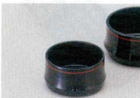
10-987-25 1-768-7 M竹型酒袴 グリーン ¥595 (7.7φ×4.1) 櫃200