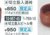
10-987-39 1-769-9 M切立筋入酒袴 ¥850 限定品 (7.8φ×4.6) 櫃200