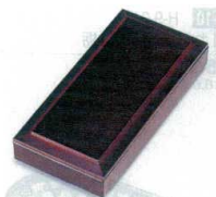
10-987-13 1-767-14 A徳川のり入れ 溜 ¥1,300 (16×7.5×2.8) 櫃100