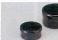
10-987-28 1-768-10 A竹型ビール袴 黒帯朱 ¥800 (9.1φ×4.8) 櫃200