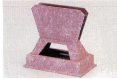
10-990-2 1-791-5 A) メニュースタンド兼 妻楊子入 和紙塗ピンク ¥1,900 (14.5×8.5×14.3)