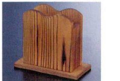
10-990-11 1-778-15 栴ねずこナフキン立て ¥1,500 (14×7×12.2) 横100