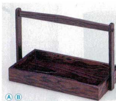
10-990-19 栴カスター盆 手付黒焼杉 1-784-17 A) (小) ¥6,000 (22.5×12×2.6) 1-784-11 B) (大) ¥7,000 (27.4×14×2.6)