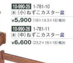
10-990-25 1-781-10 栴 (小) ねずこカスター盆 ¥5,900 (18×14.3×18) 横20