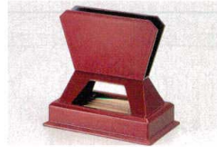
10-990-3 1-791-6 A) メニュースタンド兼 妻楊子入 ワインパール ¥1,900 (14.5×8.5×14.3)