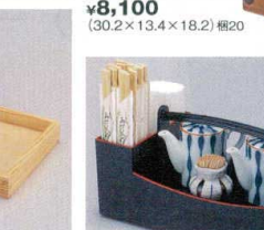
10-990-28 1-781-14 A) カスターボックス 黒天朱 ¥4,350 (33.3×15.2×16) 横10