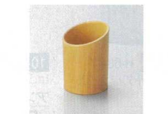
10-990-14 H-42-28 AC 伝票立て 白木 (底板付) ¥700 (4.7φ×7) 横300