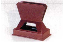
10-990-1 1-791-4 A) メニュースタンド兼 妻楊子入 レザー塗 ¥2,100 (14.5×8.5×14.3)