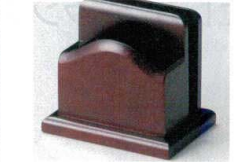
10-990-5 H-20-58 栴メニューナフキン立て ブラウン ¥4,500 (13×9.5×11.5)