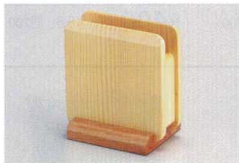
10-990-6 1-784-6 限定品 栴角ナフキン立て 白木 ¥2,400 (11×7.5×12)