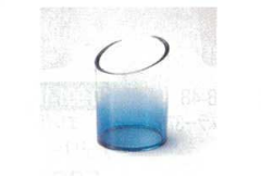
10-990-13 H-9-74 AC 伝票立て ブルー (底板付) ¥560 (4.7φ×7) 横300