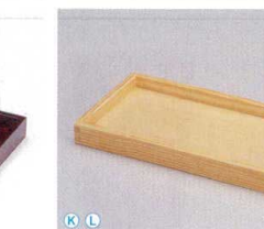
10-990-24 栴カスター盆 白木 1-784-22 K) (小) ¥3,550 (21.1×12×2.6) 1-784-16 L) (大) ¥3,950 (26.1×14×2.6)