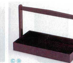
10-990-20 栴カスター盆 手付ブラウン 1-784-18 C) (小) ¥6,000 (22.5×12×2.6) 1-784-12 D) (大) ¥7,000 (27.4×14×2.6)