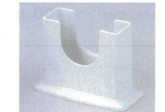
10-990-8 H-7-21 A) ナフキン立て ホワイト ¥1,150 (12.5×5.8×9.6) 横100