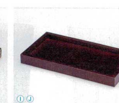
10-990-23 栴カスター盆 ブラウン 1-784-21 I) (小) ¥3,550 (21.1×12×2.6) 1-784-15 J) (大) ¥3,950 (26.1×14×2.6)