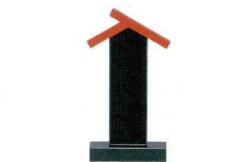
10-990-15 1-560-21 A) メニュー立て ¥625 (8×15.7) 横200