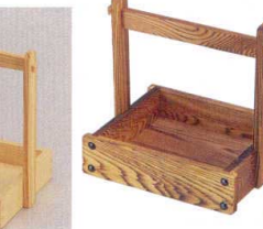
10-990-27 1-781-12 栴 (大) ねずこカスター盆 ¥8,100 (30.2×13.4×18.2) 横20