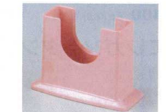
10-990-10 H-7-23 A) ナフキン立て ピンク ¥1,200 (12.5×5.8×9.6) 横100