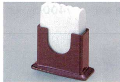
10-990-7 H-7-20 A) ナフキン立て ブラウン ¥1,100 (12.5×5.8×9.6) 横100