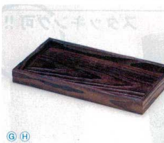
10-990-22 栴カスター盆 黒焼杉 1-784-20 G) (小) ¥3,550 (21.1×12×2.6) 1-784-14 H) (大) ¥3,950 (26.1×14×2.6)