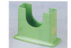
10-990-9 H-7-22 A) ナフキン立て グリーン ¥1,200 (12.5×5.8×9.6) 横100