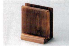
10-990-4 H-20-59 限定品 栴メニュー立て 焼杉 ¥2,400 (11×7.5×12)