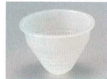
10-994-13 P.P 茶こし 1-828-1 ジャンボ用 ¥340 幅100 1-828-2 (大)用 ¥270 幅100 1-828-3 (中)用 ¥200 幅150 1-828-4 (小)用 ¥170 幅200

・茶コシは各サイズに付いています。 ・耐熱 ABS ですので割れにくく、丈夫で長持ちし大変経済的です。 ・和風向きの心落ち着くデザインです。