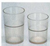
10-994-32 1-804-9 AC:PY-11S 8オンスタンブラー [スモーク] ¥360 (6.5φ×9.8) 幅200 10-994-33 1-804-10 AC:PY-10S 6オンスタンブラー [スモーク] ¥340 (6.5φ×8) 幅200