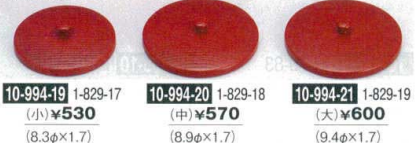
10-994-19 1-829-17 (小) ¥530 (8.3φ×1.7) 10-994-20 1-829-18 (中) ¥570 (8.9φ×1.7) 10-994-21 1-829-19 (大) ¥600 (9.4φ×1.7) 10-994-26 M 湯呑蓋(つまみなし) 黒 幅各500 H-10-17 2.1寸 ¥260 (外寸6.6φ 内寸6.2φ) H-10-18 2.2寸 ¥270 (外寸6.9φ 内寸6.5φ) H-10-19 2.3寸 ¥280 (外寸7.2φ 内寸6.8φ) H-10-20 2.4寸 ¥290 (外寸7.4φ 内寸7φ) H-10-21 2.5寸 ¥300 (外寸8.2φ 内寸7.5φ) H-10-22 2.6寸 ¥310 (外寸8.3φ 内寸7.9φ) H-10-23 2.8寸 ¥320 (外寸8.8φ 内寸8.5φ) H-10-24 3.0寸 ¥330 (外寸9.4φ 内寸9φ)