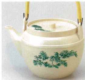
10-994-1 1-828-9 TA ジャンボ志野 グリーン竹 (3.5ℓ) ¥5,600 (29×23×19) 幅24 蓋 (16.5φ)