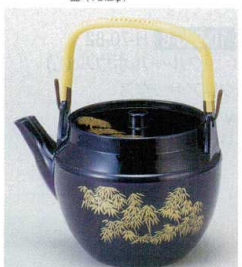
10-994-10 1-828-18 TA (大) 瑠璃金竹 (1.8ℓ) ¥4,050 (21.5×17.3×14.7) 幅30 蓋 (13.2φ)