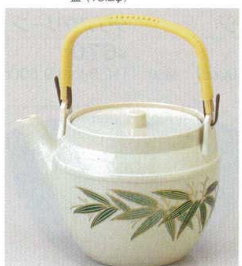
10-994-6 1-828-14 TA (大) 志野2色笹 (1.8ℓ) ¥3,980 (21.5×17.3×14.7) 幅30 蓋 (13.2φ)