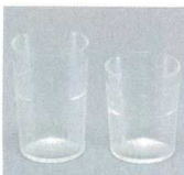
10-994-28 1-804-1 AC:AY-11 8オンスタンブラー ¥280 (6.5φ×9.8) 幅200 10-994-29 1-804-2 AC:AY-10 6オンスタンブラー ¥260 (6.5φ×8) 幅200