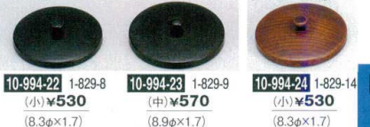
10-994-22 1-829-8 (小) ¥530 (8.3φ×1.7) 10-994-23 1-829-9 (中) ¥570 (8.9φ×1.7) 10-994-24 1-829-14 (小) ¥530 (8.3φ×1.7) 10-994-27 M 湯呑蓋(つまみ付) 黒 幅各500 H-10-25 2.1寸 ¥280 (外寸6.6φ 内寸6.2φ) H-10-26 2.2寸 ¥290 (外寸6.9φ 内寸6.5φ) H-10-27 2.3寸 ¥300 (外寸7.2φ 内寸6.8φ) H-10-28 2.4寸 ¥310 (外寸7.4φ 内寸7φ) H-10-29 2.5寸 ¥320 (外寸8.2φ 内寸7.5φ) H-10-30 2.6寸 ¥330 (外寸8.3φ 内寸7.9φ) H-10-31 2.8寸 ¥340 (外寸8.8φ 内寸8.5φ) H-10-32 3.0寸 ¥350 (外寸9.4φ 内寸9φ)