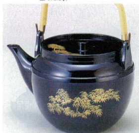
10-994-9 1-828-17 TA ジャンボ瑠璃金竹 (3.5ℓ) ¥5,950 (29×23×19) 幅24 蓋 (16.5φ)