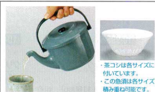
10-994-15 P.P 急須 青磁 1-829-1 (小)0.7ℓ ¥2,800 (18×12.8×15) 幅60 1-829-2 (中)1ℓ ¥3,400 (20×15×16) 幅30 1-829-3 (大)1.8ℓ ¥3,900 (26×18.7×23) 幅24