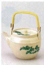
10-994-4 1-828-12 TA (小) 志野 グリーン竹 (0.7ℓ) ¥2,400 (17×13×10.8) 幅60 蓋 (10φ)

・茶コシは各サイズに付いています。 ・耐熱 ABS ですので割れにくく、丈夫で長持ちし大変経済的です。 ・和風向きの心落ち着くデザインです。