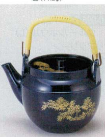
10-994-11 1-828-19 TA (中) 瑠璃金竹 (1ℓ) ¥3,140 (19×15×13.7) 幅30 蓋 (11.5φ)