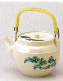
10-994-3 1-828-11 TA (中) 志野 グリーン竹 (1ℓ) ¥2,930 (19×15×13.7) 幅30 蓋 (11.5φ)