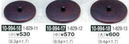
10-994-16 1-829-11 (小) ¥530 (8.3φ×1.7) 10-994-17 1-829-12 (中) ¥570 (8.9φ×1.7) 10-994-18 1-829-13 (大) ¥600 (9.4φ×1.7) 10-994-25 P.P 湯呑蓋(つまみ付) 黒 幅各500 H-19-53 2.3寸 ¥140 (外寸7.3φ 内寸6.9φ) H-19-54 2.4寸 ¥160 (外寸7.3φ 内寸7.2φ) H-19-55 2.5寸 ¥180 (外寸8φ 内寸7.5φ) H-19-56 2.6寸 ¥190 (外寸8.3φ 内寸7.7φ) H-19-57 2.7寸 ¥210 (外寸8.5φ 内寸7.9φ) H-19-58 2.8寸 ¥240 (外寸8.9φ 内寸8.2φ)