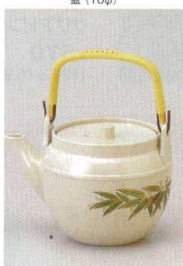
10-994-8 1-828-16 TA (小) 志野2色笹 (0.7ℓ) ¥2,570 (17×13×10.8) 幅60 蓋 (10φ)