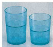
10-994-30 1-804-7 AC:PY-11E 8オンスタンブラー [エメラルド] ¥360 (6.5φ×9.8) 幅200 10-994-31 1-804-8 AC:PY-10E 6オンスタンブラー [エメラルド] ¥340 (6.5φ×8) 幅200