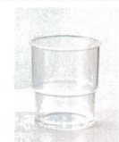
10-994-34 J-2-11 AC:段付コップ透明 ¥240 (6.8φ×8) 幅200