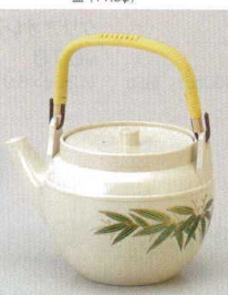
10-994-7 1-828-15 TA (中) 志野2色笹 (1ℓ) ¥3,100 (19×15×13.7) 幅30 蓋 (11.5φ)