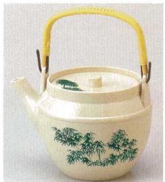
10-994-2 1-828-10 TA (大) 志野 グリーン竹 (1.8ℓ) ¥3,860 (21.5×17.3×14.7) 幅30 蓋 (13.2φ)