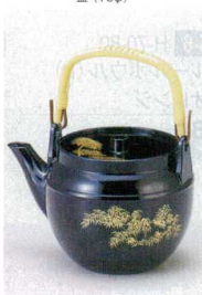
10-994-12 1-828-20 TA (小) 瑠璃金竹 (0.7ℓ) ¥2,600 (17×13×10.8) 幅60 蓋 (10φ)