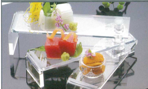
アクリル立体盛付台 17-147-04 (30157) 3,800円 収納時約18×5×H5.6cm 上段 約18×5×H5cm/中段 約16×5×H3.5cm/下段 約14×5×H2cm