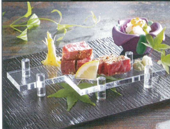
アクリルハツ橋 17-147-07 (32258) 三連 1,450円 約11×6.5×H2.5cm 17-147-08 (32257) 中 2,300円 約18×9.3×H2.8cm