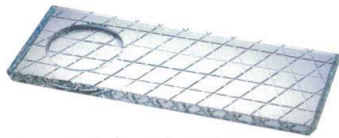
クリスタル切子プレート(のぞき付) 17-147-01 (08549) 4,950円 約24×9×H0.9cm ※穴約φ6×H0.5cm