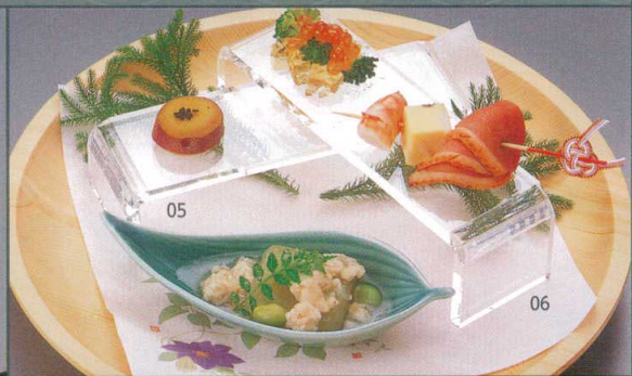
アクリル高台盛皿 17-147-05 (32261) 低 1,500円 約16.5×5×H3.4cm 17-147-06 (32262) 高 1,550円 約16.5×5×H4.6cm