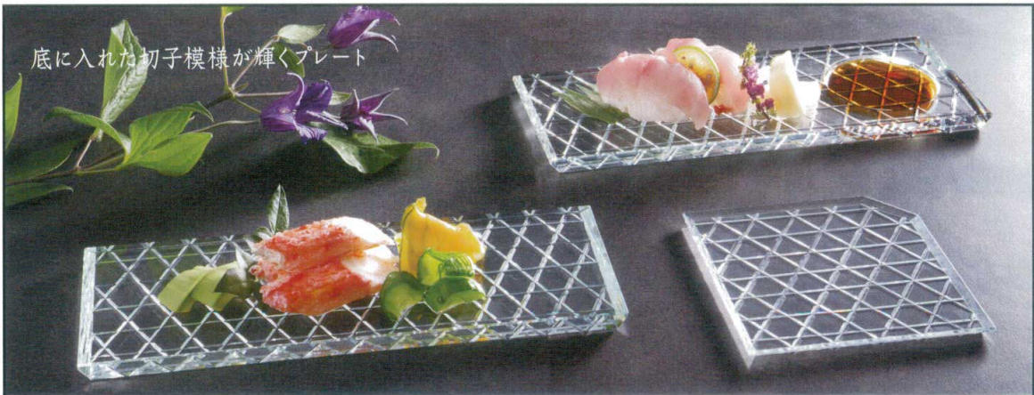
底に入れた切子模様が輝くプレート