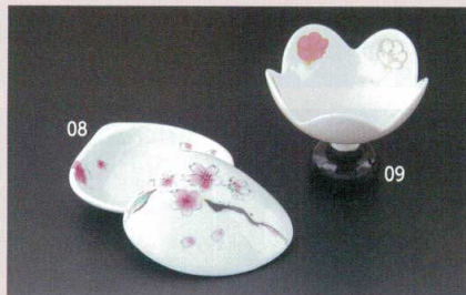
錦桜画具型珍味 赤羽根型小付 17-212-08 (26916) 1,220円 約7.7×6.7×H3.7cm 17-212-09 (25775) 1,450円 約φ7.2×H6.2cm 強化磁器 ※P201参照