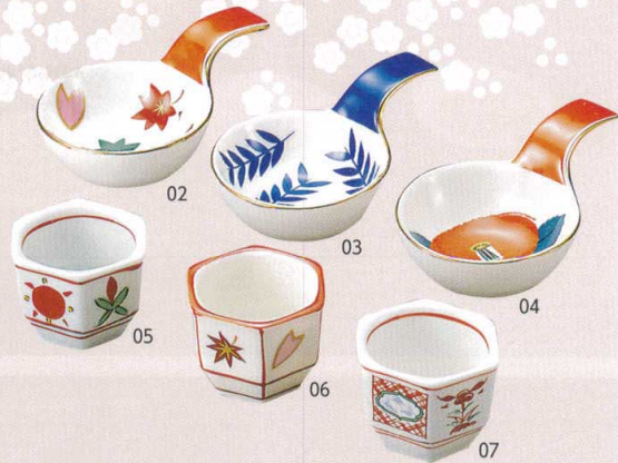
陶器・ミニレンゲ珍味入 陶器・ぼんぼり 17-212-02 (26608) 春秋 280円 17-212-05 (26602) 丸紋 160円 17-212-03 (26609) 草紋 280円 17-212-06 (26601) 春秋 160円 17-212-04 (26607) 椿 280円 17-212-07 (26603) 山水 160円 約8.5×5.8×H3.6cm ※輸入陶器(小箱10ヶ入) 約φ4.5×H3.3cm ※輸入陶器(小箱20ヶ入)