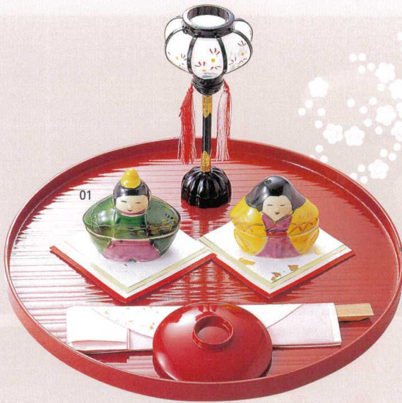
陶器・おひな様珍味入セット(一組)(陶器のみ) ※バラ売り不可 17-212-01 (25401) 6,000円 内裏 約8.5×4.8×H9.3cm/蓋 約8×4.7×H7.8cm ※器・ぼんぼりはイメージ