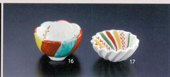
十草三ツ足珍味入 彩り菊型珍味入 17-212-16 (26107) 630円 17-212-17 (26108) 750円 約φ7×H3.8cm 約φ7×H2.8cm