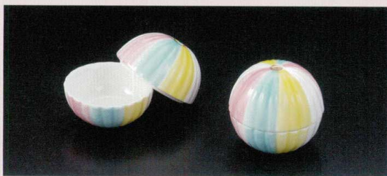
花手毬珍味入 17-212-15 (26250) 580円 約φ5.4×H5.2cm ※輸入陶器(小箱10ヶ入) ※価格は1個