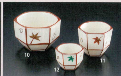
陶器(ぼんぼり) 17-212-10 (25319) 大 1,150円 約φ8.2×H5.1cm 17-212-11 (25320) 中 790円 約φ5.7×H4.7cm 17-212-12 (25303) 小 720円 約φ4.5×H3.2cm