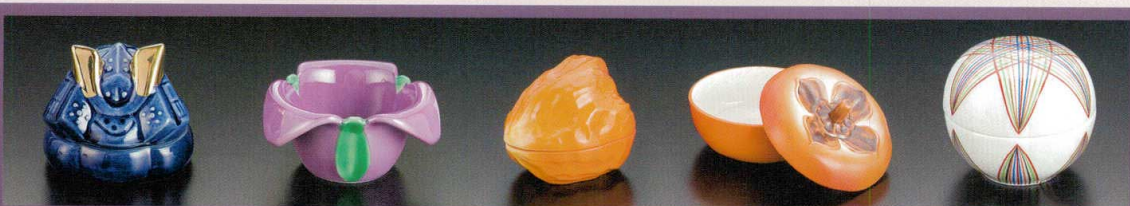
かぶと珍味入 あやめ珍味入 鬼灯(ほおずき)珍味入 柿珍味入(小) 友禅子筋手まり珍味入 17-212-18 (25402) 2,500円 17-212-19 (25582) 2,050円 17-212-20 (26359) 2,000円 17-212-21 (26396) 2,000円 17-212-22 (25529) 1,900円 約5.8×6.2×H5cm 約φ7.5×H3.5cm 約4.3×5.6×H4.8cm 約φ6.2×H4.7cm 約φ6.2×H6cm