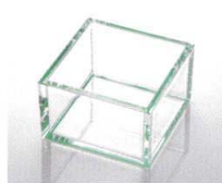
裏側の色のラインが乱反射して立体的な色の演出をするアクリルの枱です。 クリア1合枱 ※P230参照