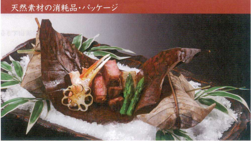
天然素材の消耗品・パッケージ