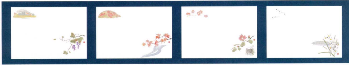
17-286-05 (64966) 山ぶどう (9月~10月)