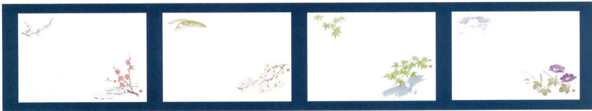
17-286-01 (64961) 梅 (1月~3月)