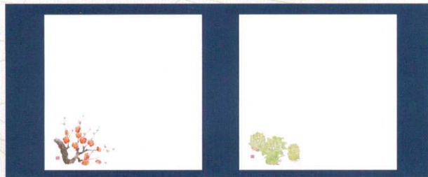
17-292-01 (68801) 梅 (1月～3月)