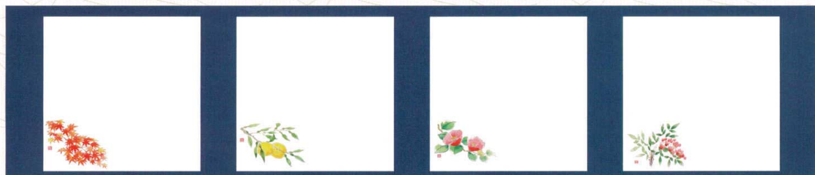
17-292-11 (68823) 赤もみじ (10月～11月)