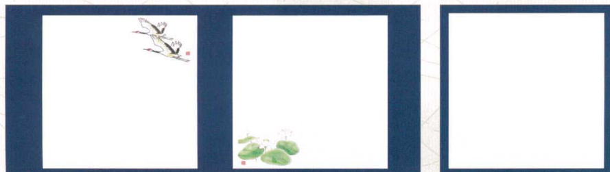
17-292-15 (68833) 鶴