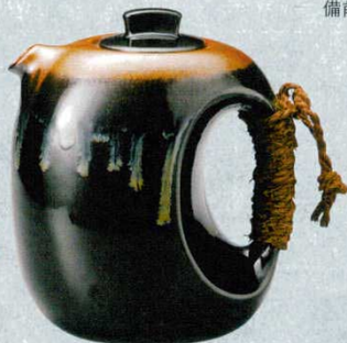
363-19-314 3,300円 天目縄巻ポット7号 (16×12×19cm・1500cc) 1入