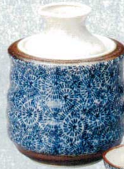
363-04-654 4,380円 細たこ唐草酒燗器 大 (11.6×15cm・300cc) 363-05-654 790円 細たこ唐草ぐい呑 大 (7×4.5cm)