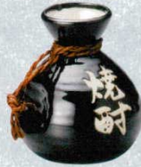
363-02-314 750円 焼酎1号金着德利 (8×9cm・220cc) 10入