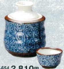
363-06-654 2,810円 細たこ唐草酒燗器 小 (10×12.6cm・140cc) 363-07-654 790円 細たこ唐草ぐい呑 中 (5.9×4cm)