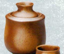
363-16-404 2,400円 備前吹酒燗器(小)德利付 (9.5×12cm・140cc) 1入 363-17-404 450円 備前吹グイ呑 (5.5×4.1cm) 40入