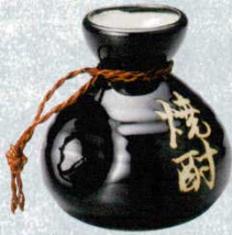
363-01-314 880円 焼酎2号金着德利 (10×11cm・360cc) 10入