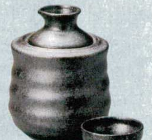
363-22-404 2,100円 銀黒酒燗器 小 (10×12.5cm・140cc) 1入 363-23-404 480円 銀黒グイ呑 (5.8×3.8cm)