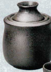
363-11-314 4,250円 黒結晶酒燗器セット(大) (300cc)