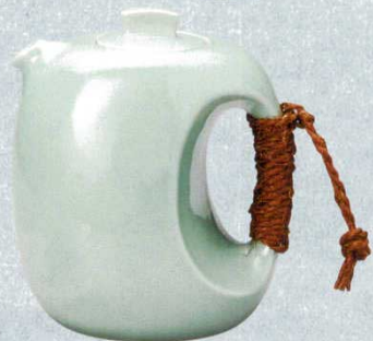
363-18-314 3,300円 青地縄巻ポット7号 (16×12×18cm・1500cc) 1入