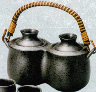
363-13-314 5,700円 黒結晶1号酒燗器(W) (盃2個付) (21×9.5×18cm・各150cc) 1入