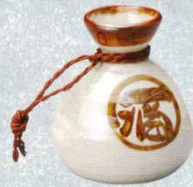
363-09-314 680円 丸酒金着形1号德利 (8×9cm・220cc) 10入