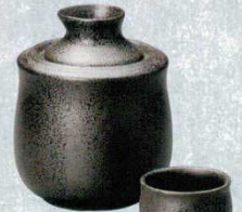
363-12-314 2,700円 黒結晶酒燗器セット(小) (150cc)