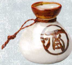
363-08-314 820円 丸酒金着形2号德利 (10×11cm・360cc) 10入