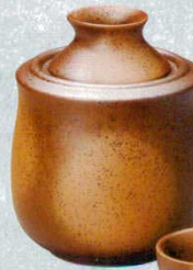
363-14-404 3,800円 備前吹酒燗器(大)德利付 (12×15cm・300cc) 1入 363-15-404 480円 備前吹大丸グイ呑 (7×4.5cm)