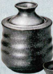
363-20-404 3,400円 銀黒酒燗器 大 (12.5×16cm・300cc) 1入 363-21-404 500円 銀黒波測グイ呑 (7×4.6cm)