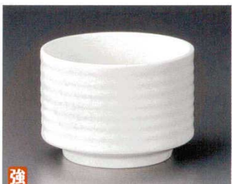
447-24-224 1,620円 白磁筒型飯器(小) (10.3×7.4cm)