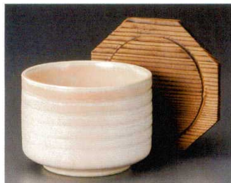
447-09-514 1,460円 窯変ピンク蓋付飯器 (12.5×10cm) 447-10-514 1,000円 窯変ピンク飯器 (10.6×7.8cm)