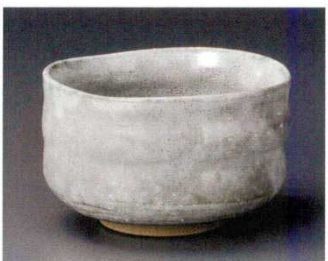
447-21-564 2,000円 灰釉飯器 (12.1×7.7cm)