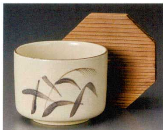
447-17-084 1,400円 志野芦蓋付飯器 (12.5×9cm) 447-18-084 960円 志野芦飯器(身) (10×7.5cm)