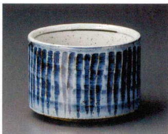
447-19-024 2,080円 石焼ごす巻飯器 (11×7.5cm)