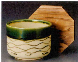
447-05-084 1,500円 織部渦蓋付飯器 (12.5×9cm) 447-06-084 1,060円 織部渦飯器(身) (10×7.5cm)