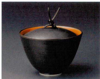
447-13-514 1,460円 柿釉蓋付飯器 (11.3×8.6cm) 447-14-514 890円 柿釉飯器(身) (11.3×7.5cm)