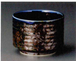
447-23-224 1,620円 いろり筒型飯器小身 (10.4×7.6cm)