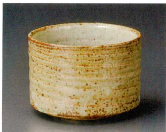
447-22-024 1,730円 石焼かいらぎ飯器 (10.5×6cm)