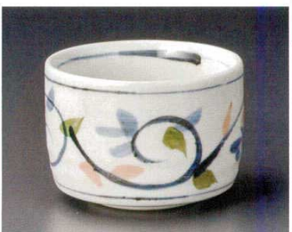
447-25-504 1,300円 色唐草飯器 (10.8×8cm)