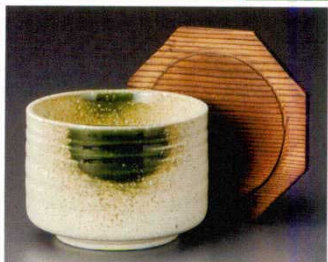
447-07-514 1,550円 粉引グリーン吹き蓋付飯器 (12.3×11.4×9cm) 447-08-514 1,090円 粉引グリーン吹き飯器(身) (11×7.6cm)