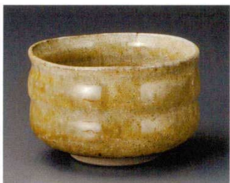
447-20-564 2,000円 黄釉飯器 (12.1×7.7cm)