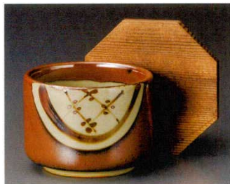
447-01-494 1,650円 茶益子丸紋蓋付飯器 (11.8×9.3cm) 447-02-494 1,280円 茶益子丸紋飯器(身) (10.5×8cm)