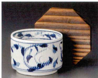
447-11-494 1,280円 青磁唐草蓋付飯器 (11.8×8.5cm) 447-12-494 900円 青磁唐草飯器 (10.2×7.2cm)