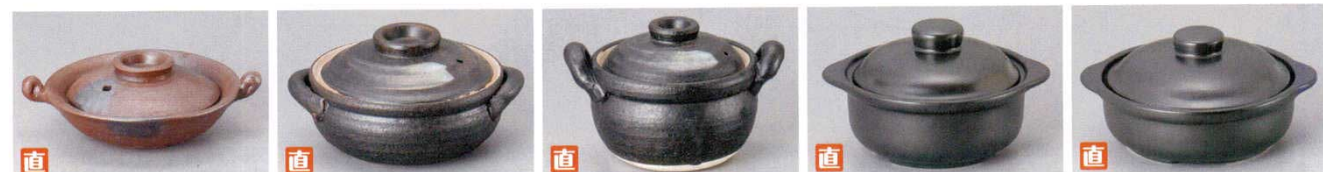
597-21-714 2,500円 南蛮黒吹ミ二様石鍋 (17.5×14.2×5.6cm・身3.7cm・150cc) | 597-22-714 2,100円 黒陶刷毛目4.5号鍋 (16.5×13.5×8cm・身5.4cm・400cc) | 597-23-714 2,350円 黒陶刷毛目4号多用深鍋 (16×12.5×10.5cm・身7.8cm・650cc) | 597-24-644 2,450円 黒5吋オニオン(組) (14.6×12.7×8.5cm) | 597-25-644 1,650円 黒5吋オニオン(身のみ) (14.6×12.7×5.3cm) | 597-26-644 3,250円 黒61/2キャセロール(組) (17.4×15.4×8.7cm) | 597-27-644 2,000円 黒キャセロール(身のみ) (17.4×15.4×5.2cm)