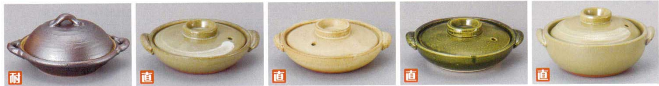
597-06-734 1,650円 鉄袖レンジ小鍋 大 (15.5×13×7cm・身3cm) | 597-07-734 2,500円 ネズハケ4号平鍋 (15×12.5×5.5cm・身3.3cm) | 597-08-734 2,500円 バニラ4号平鍋 (15×12.5×5.5cm・身3.3cm) | 597-09-734 2,500円 織部4号平鍋 (15×12.5×5.5cm・身3.3cm) | 597-10-734 2,950円 ネズハケ4.5号鍋 (15×13×8.5cm・身5cm)