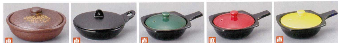
597-28-714 2,500円 焼締5号平鍋 (15.5×7.5cm・身4.7cm・320cc) | 597-29-734 2,650円 黒片手パン(グラタン兼用) (19×15×8cm・身4cm) | 597-30-734 2,000円 片手エッグパン 緑 (16×11.5×7cm・身4cm) | 597-31-734 2,000円 片手エッグパン 赤 (16×11.5×7cm・身4cm) | 597-32-734 2,000円 片手エッグパン 黄 (16×11.5×7cm・身4cm)

萬古焼 オープン 機能鍋 ご飯鍋 柳川鍋 会席鍋 石板子付鍋 石鍋・耐熱食器 アルミ製品 コンロ・汁次 アラ入土瓶むし