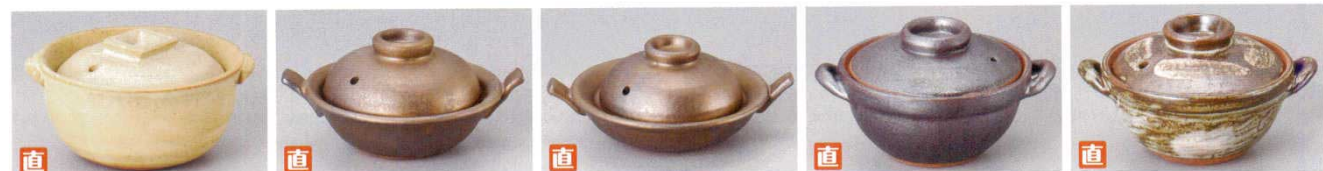
597-16-734 2,750円 バニラ4号雑炊鍋 (14.5×13×8cm・身6.5cm) | 597-17-734 2,200円 金彩4.5号鍋 (17×14×8cm・身4cm) | 597-18-734 2,200円 金彩4.5号平鍋 (17.5×14.5×7cm・身4cm) | 597-19-714 2,300円 鉄結晶4号鍋 (15.5×12.5×8.8cm・身6cm・280cc) | 597-20-714 2,300円 唐津刷毛目4号鍋 (15.5×12.5×8.8cm・身6cm・280cc)