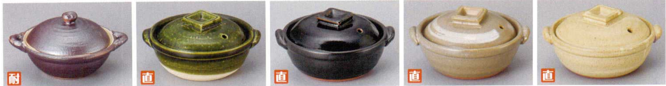
597-01-734 1,400円 鉄袖レンジ小鍋 中 (12.5×10×6.5cm・身3.5cm) | 597-02-714 2,700円 織部4号浅鍋 (14×12.5×8cm・身4.3cm・200cc) | 597-03-714 2,700円 柚子天目4号浅鍋 (14×12.5×7.5cm・身4.3cm・200cc) | 597-04-714 2,700円 京風白刷毛目4号浅鍋 (14×12.5×7.5cm・身4.3cm・200cc) | 597-05-734 2,700円 バニラ4号鍋 (14×12.5×7cm・身4.5cm)