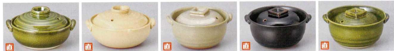
597-11-734 2,950円 織部4.5号鍋 (15×13×8.5cm・身5cm) | 597-12-734 2,950円 バニラ4.5号鍋 (15×13×8.5cm・身5cm) | 597-13-714 2,750円 京風白刷毛目4号深鍋 (15×13×8.5cm・身6.7cm・300cc) | 597-14-714 2,750円 柚子天目4号深鍋 (15×13×8.5cm・身6.7cm・300cc) | 597-15-714 2,750円 織部4号深鍋 (14.5×13×8.5cm・身6.7cm・300cc)