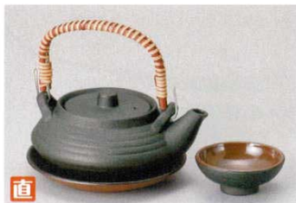
613-15-724 2,150円 黒マツ土瓶むし(耐熱) (9.5×11.5cm・200cc) 1入 輸入