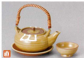
613-10-714 2,450円 イラボ丸型土瓶むし(耐熱) (10.8×6.8cm・350cc) 輸入