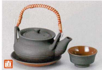
613-03-734 2,400円 DF-5耐熱土瓶蒸し (320cc) 1入 輸入