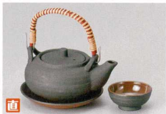
613-08-734 2,400円 DG-5耐熱土瓶蒸し (350cc) 1入 輸入