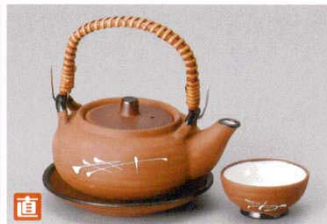
613-06-734 2,400円 DG-9耐熱土瓶蒸し (350cc) 1入 輸入