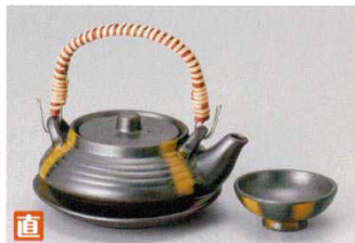
613-14-734 2,150円 DE-4耐熱土瓶蒸し (200cc) 1入 輸入