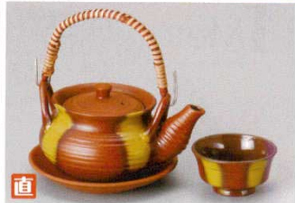
613-04-734 2,400円 DF-3耐熱土瓶蒸し (320cc) 1入 輸入