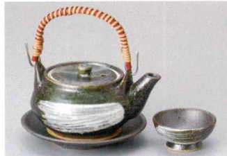
613-01-744 3,410円 白刷毛目土瓶蒸し (300cc) 1入