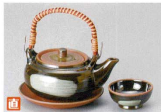
613-09-724 2,400円 天目刷毛土瓶蒸し(耐熱) (10.5×11.5cm・350cc) 1入 輸入