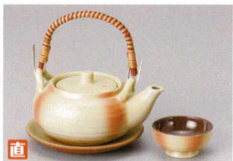
613-12-734 2,400円 DG-1耐熱土瓶蒸し (350cc) 1入 輸入