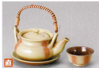
613-05-734 2,400円 DF-1耐熱土瓶蒸し (320cc) 1入 輸入