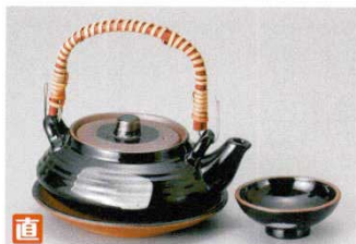
613-17-724 2,150円 天目土瓶むし(耐熱) (9.5×11.5cm・200cc) 1入 輸入