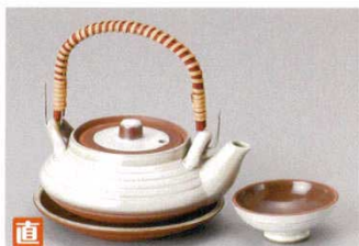
613-18-724 2,150円 平型白釉土瓶蒸し(耐熱) (9.5×11.5cm・200cc) 1入 輸入