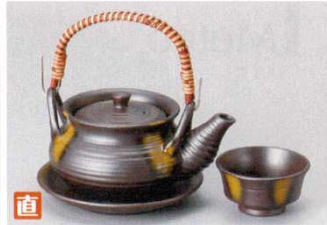
613-02-724 2,400円 福型荒土土瓶むし(耐熱) (11.5×11cm・320cc) 1入 輸入