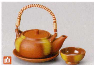
613-11-714 2,400円 鉄丸型土瓶むし(耐熱) (10.8×6.8cm・350cc) 輸入