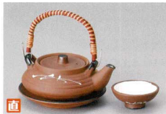
613-13-734 2,150円 DE-1耐熱土瓶蒸し (200cc) 1入 輸入