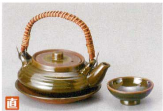
613-16-714 2,150円 オリベ平型土瓶むし(耐熱) (11.8×6.3cm・200cc) 輸入