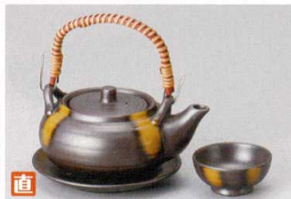
613-07-734 2,400円 DG-4耐熱土瓶蒸し (350cc) 1入 輸入