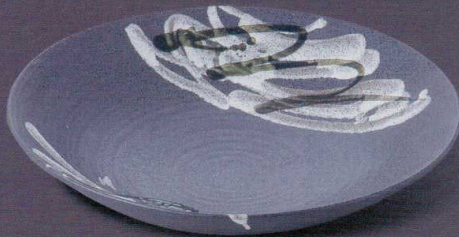
242-101-510 15,500円 鉄黒乱線紋尺2大鉢 (36.3×8.6) 522810351