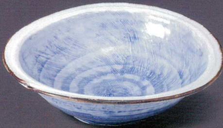
242-201-050 10,800円 呉須くし目たわみ大鉢 (35.2×33.2×9.3) 1024220105