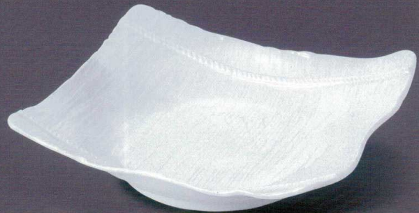
242-202-050 6,800円 白磁柴垣11.0盛皿 (35×31.5×9) 522940205