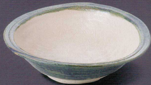
陶 242-102-340 9,700円 外織部クシメたわみ大鉢 (37×35×10) 522840134