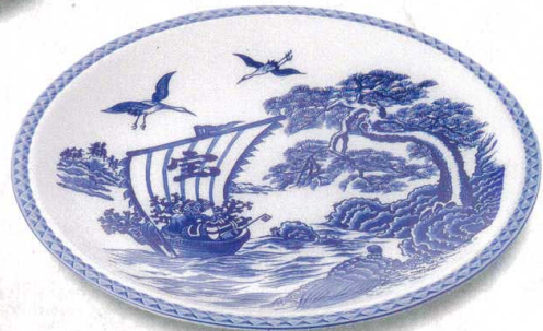
陶 269-403-820 2,800円 宝舟 12.0大皿(36.5×36.5×4) 525710182 269-404-820 1,750円 宝舟 10.0大皿(32×32×3.5) 525710282