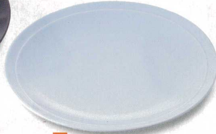
陶 269-104-810 3,200円 高台青磁12.0皿(38×4.5) 525740281 269-105-810 2,900円 高台青磁11.0皿(34.5×4) 525740381 269-106-810 2,400円 高台青磁10.0皿(32×5) 525740481