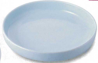
陶 269-107-810 2,800円 青磁10.0盛鉢(30×6) 525740581