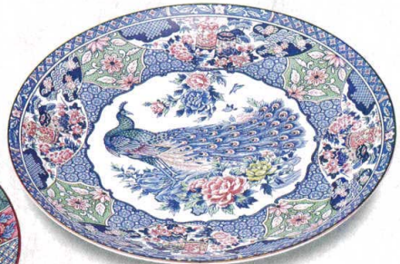
陶 269-303-810 2,300円 伊万里孔雀10.0皿(31.5×3) 724910681