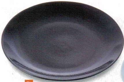
陶 269-101-810 5,300円 ゆず天目13.0丸皿(41.5×5.5) 525730481 269-102-810 2,900円 ゆず天目12.0丸皿(37×3.5) 525730581 269-103-810 2,200円 ゆず天目10.0丸皿(31.5×3) 525730681