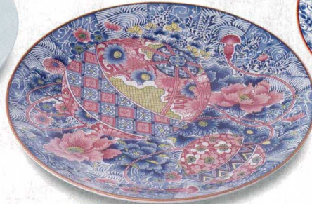
陶 269-204-820 5,200円 てまり 13.0大皿(42×42×5.5) 525720282 269-205-820 3,200円 てまり 12.0大皿(37×37×4.5) 525720382 269-206-820 2,200円 てまり 10.0大皿(32×32×4) 525720482