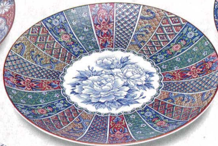
陶 269-302-810 2,300円 染錦10.0皿(31.5×3) 724920181