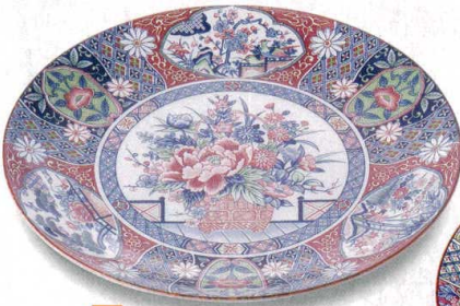
陶 269-301-810 2,300円 花かご10.0皿(31.5×3) 525740181