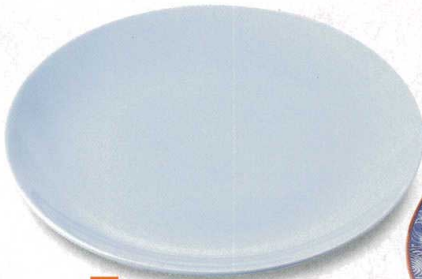
陶 269-201-840 5,000円 青地13.0皿(42.5×5) 1026920184 269-202-840 2,800円 青地12.0皿(36×3.5) 525730284 269-203-840 1,700円 青地10.0皿(31.5×3) 525730384