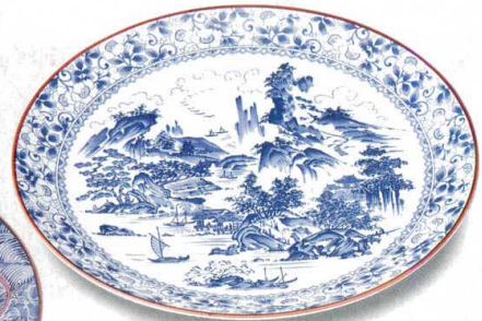
陶 269-207-820 5,000円 新古木山水13.0皿(42×42×5.5) 724920582 269-208-820 2,800円 新古木山水12.0皿(37×37×4.5) 724920682 269-209-820 1,800円 新古木山水10.0皿(32×32×4) 724920782