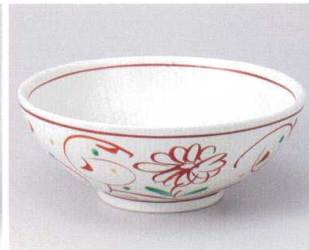
329-503-300 1,650円 粉引釉赤絵花7.0麵鉢(21.3×8) 829640130