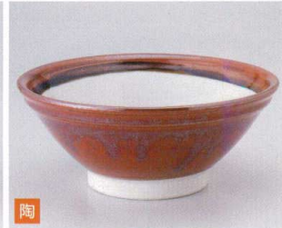
329-304-300 1,700円 赤釉中白7.0井(21.8×9) 530550230