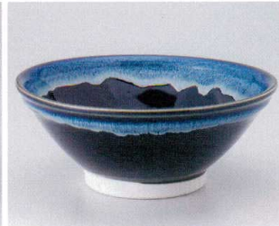
329-303-150 1,800円 均窯流し7.0麵井(22×9) 530550115