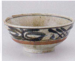
329-203-310 2,150円 信楽風唐草玉6.8井(20×9) 530530331 329-204-310 1,680円 信楽唐草玉6.0井(19×8.05) 729120331