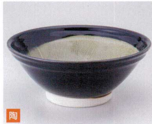
329-301-300 1,700円 黒釉7.0スリ鉢井(21.8×9) 530550330