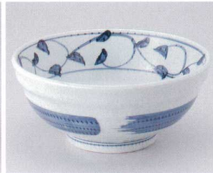
329-205-250 1,900円 京古染唐草玉淵6.0井(19×8.5) 530650125