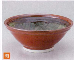
329-302-300 1,700円 赤釉7.0スリ鉢井(21.8×9) 530550430