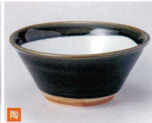
329-403-330 1,700円 織部中白 6.0駒型井(20×9.1) 830810433