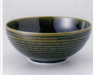
329-103-330 2,250円 織部千段6.5井(19.5×8.4) 530540133