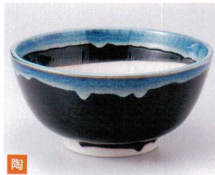
329-501-410 2,000円 すり鉢 6寸 天目均窯(18.3×9) 932450541