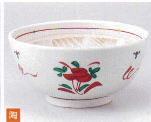
329-502-410 2,300円 すり鉢 6寸 赤絵立花(18.3×9) 932450441