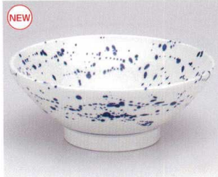
329-101-310 2,500円 コス散し 7.0井(21.7×8.7) 1032910131