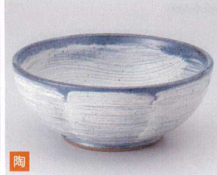
329-102-570 2,600円 ブルー刷毛目多用井(18.5×7.5) 530620157