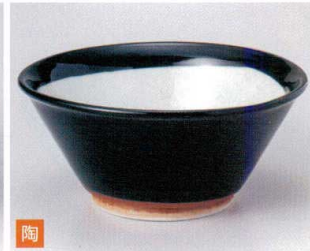
329-404-330 1,700円 天目中白 6.0駒型井(20×9.1) 830810333