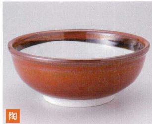
329-401-300 2,200円 赤釉中白7.0ポール(21×8.8) 530530230