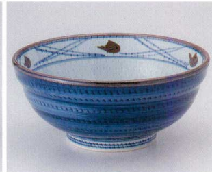
329-206-250 1,800円 コス巻サビ点玉淵6.0井(19×8.5) 530640325