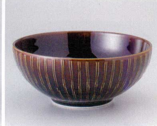
329-104-330 2,250円 ア×釉十草6.5井(19.5×8.4) 530540233