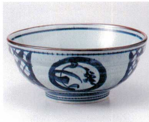
329-201-310 2,180円 間取福穂 6.8玉井(20×9) 932520331 329-202-310 1,750円 間取福穂 6.0玉井(19×8.5) 932520431