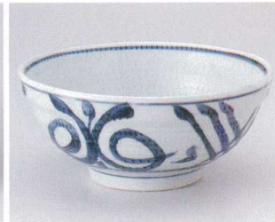
329-504-310 1,580円 京古染玉6.0井(18.8×8.5) 530650331