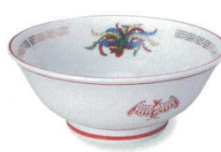
692-303-260 1,700円 金雷門反高台6.3井 (19×7.7-880cc) 865840326