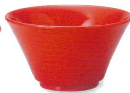
692-503-310 4,000円 赤釉6.0切立深井 (18.7×10.7-1380cc) 660310431