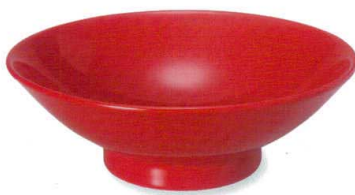
692-501-310 6,200円 エスベランサ 8.0ラーメン井(赤) (24.5×8.2-1600cc) 865940131