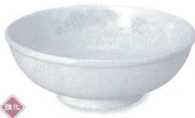
692-101-260 4,000円 スーパーチャイナ華清(絵付)7.0寸反高台井 (20.9×8.5-1250cc) 865810126 692-102-260 3,000円 スーパーチャイナ華清(絵付)6.5寸反高台井 (19.5×8-1150cc) 865810226