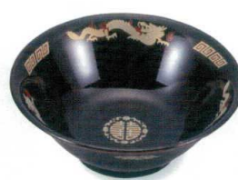
692-203-350 1,680円 天目金彩竜6.8切立井 (20.3×7.6-940cc) 866650235