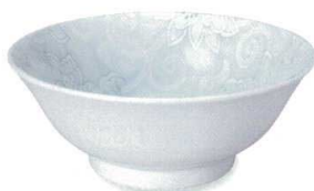
692-401-260 2,500円 吉祥鳳7.0反高台井(21.7×8.8-1280cc) 865850126 692-402-260 1,900円 吉祥鳳6.5反高台井(20.2×8.4-1170cc) 865850226