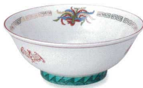
692-301-260 2,150円 金雷門反高台6.8井 (21.2×8.5-1350cc) 865840126