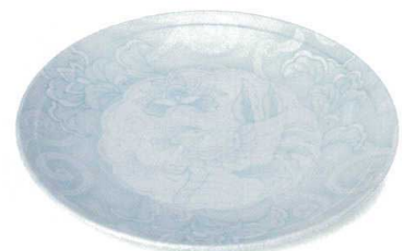
692-406-260 14,500円 吉祥鳳丸11.0皿(34×4.3) 865850626 692-407-260 9,000円 吉祥鳳丸10.0皿(31.5×4) 865850726