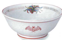
692-302-260 1,800円 金雷門反高台6.5井 (20.1×8.3-1260cc) 865840226