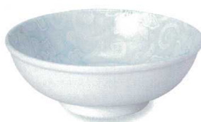
692-403-260 3,800円 吉祥鳳7.0玉井(21.8×8-1350cc) 865850326 692-404-260 2,700円 吉祥鳳6.5玉井(19.7×7.5-1000cc) 865850426