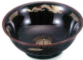
692-201-350 2,250円 天目金彩竜6.8反高台井 (21×8.3-1300cc) 560220335