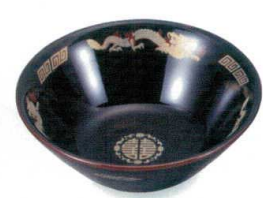
692-204-350 1,380円 天目金彩竜6.3切立井 (19.5×6.8-900cc) 560220135