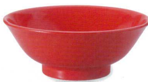
692-502-630 1,450円 高台7.0井(赤) (21.4×8.6-1500cc) 865940463