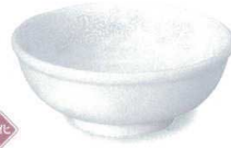
692-103-260 5,700円 スーパーチャイナ華清(絵付)7.0寸玉井 (21.2×7.8-1350cc) 865810326 692-104-260 4,200円 スーパーチャイナ華清(絵付)6.5寸玉井 (19.3×7.2-1050cc) 865810426