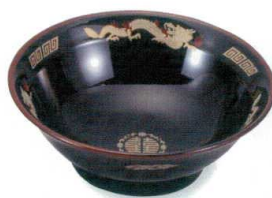
692-202-350 2,350円 天目金彩竜リム7.0井 (21.5×7.7-1120cc) 560220435