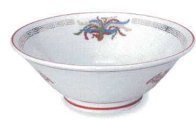
692-304-260 1,700円 金雷門切立6.8井(20.5×7.5-930cc) 865840426 692-305-260 1,400円 金雷門切立6.3井(19.7×6.5-950cc) 865840526