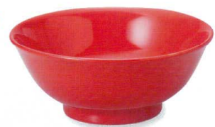
692-504-080 2,400円 赤釉6.5反高台井 (20×8.2-1190cc) 660320308