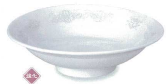
692-105-260 3,250円 スーパーチャイナ華清(絵付)5.0寸玉井 (15.6×6.2-570cc) 865810526