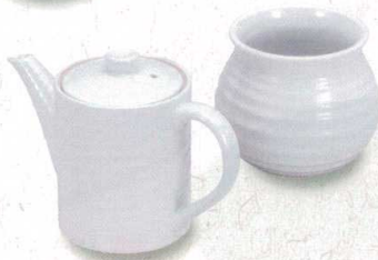
陶 718-403-840 3,800円 白磁汁次(1000cc) 565110584 718-404-840 3,100円 白磁荒入(12×13) 565110684