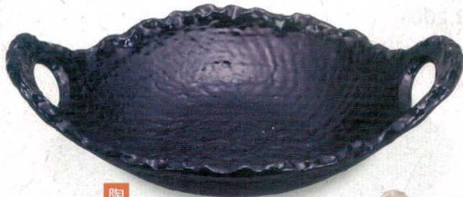
陶 718-201-820 3,100円 黒釉8.0変形陶板(32×26×8) 564520382