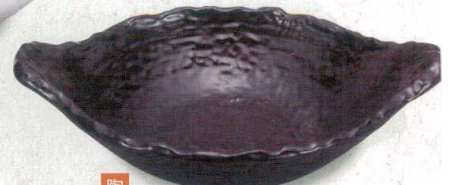
陶 718-304-250 2,400円 茶 22センチ変形浅鍋(28×22×6.8) 868330325