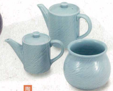
陶 718-408-840 3,500円 青磁斜線汁次(大)(1000cc) 565110184 718-409-840 3,000円 青磁斜線汁次(小)(500cc) 565110284 718-410-840 3,000円 青磁斜線荒入(大)(12×13) 565110384