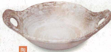
陶 718-102-820 1,850円 志野6.0変形陶板(24×19.5×7) 564520282