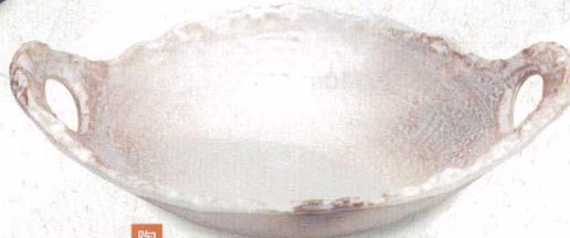
陶 718-202-820 3,100円 志野8.0変形陶板(32×26×8) 564520182