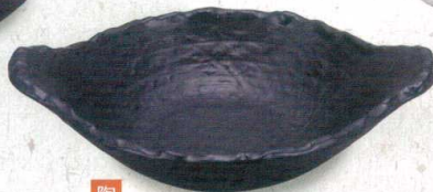
陶 718-302-250 2,400円 黒 22センチ変形浅鍋(28×22×6.8) 868330125