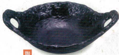
陶 718-101-820 1,850円 黒釉6.0変形陶板(24.3×19×6.5) 564520482