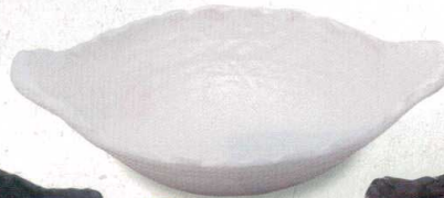
陶 718-303-250 2,400円 白 22センチ変形浅鍋(28×22×6.8) 868330225