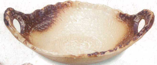
陶 718-203-840 3,100円 伊良保8.0変形陶板(31.5×25.5×8) 564510284