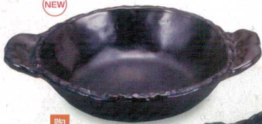
陶 718-301-840 2,000円 灰釉平鍋陶板(24.5×18.5×5) 1071830184