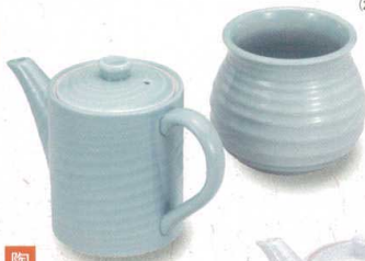
陶 718-401-840 3,800円 青磁汁次(1000cc) 565120184 718-402-840 3,100円 青磁荒入(12×13) 565120284