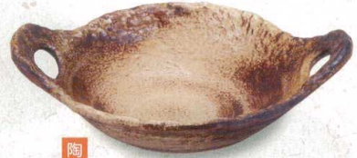
陶 718-103-840 1,850円 伊良保6.0変形陶板(24.3×19×6.5) 564510384