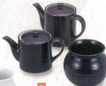
陶 718-405-810 3,100円 天目汁次(大)(900cc) 565120381 718-406-810 2,900円 天目汁次(小)(700cc) 565120481 718-407-840 3,000円 天目荒入(11×11.5) 565120584