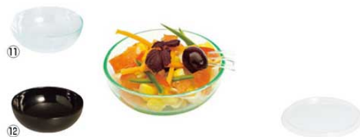
⑪ ミニサラダボール 50㎖ (50入) ㊦ ⑬ ミニサラダボール用蓋 (200入) クリア PS30379 ㊦