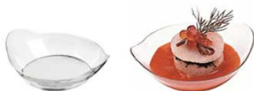
⑭ ラウンドディッシュ 45㎖ (100入) クリア CS50710 ㊦