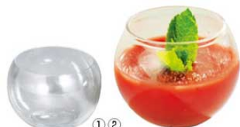
① スフェア クリア (5入) ㊦