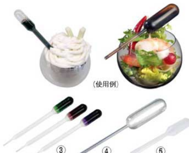
③ ピペット (100入) クリア ㊦