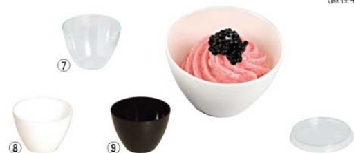
⑦ ミニボール 30㎖ (50入) ㊦ ⑩ ミニボール用蓋 (200入) クリア PS30319 ㊦