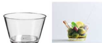
⑥ コニックカップ 150㎖ (100入) クリア PS33210 ㊦

材質:ポリエチレン 耐熱温度:-10~70℃ ●3.3㎖は、軸部が太く多少のつぶつぶも吸い上げられます。 (直径4.5mm)