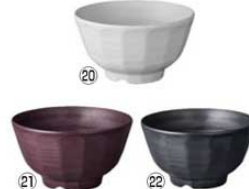
鉢 15cm 切