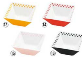
スクエアボウル10 CH-10 切