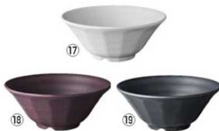
ラーメン鉢 20cm 切