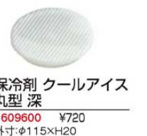
⑯保冷剤 クールアイス 丸型 深