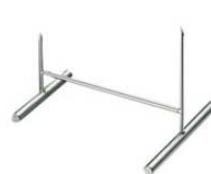
⑩EBM 18-8 魚剣山

幅135(100)×H60(50) ●長さを150~280まで調節できます。 針の長さ:50(40)