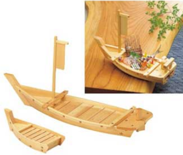
①白木 盛込舟 (川舟)