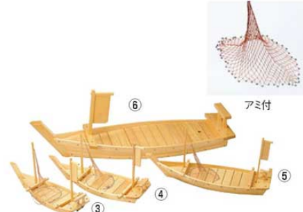
木製 大漁舟 黒潮