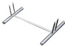
⑨EBM 18-8 二本刃 魚剣山