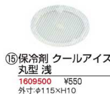
⑮保冷剤 クールアイス 丸型 浅