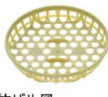
⑯竹ザル風 丸 ブラザル (10個入) グリーン 5801 150