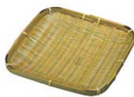
⑦竹 盛皿 17K-20