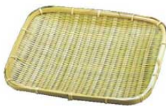
⑥竹角長 盛皿 20-009