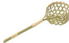
㉒竹 とうじそば用ザル 丸 15-131