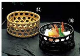
⑭白竹 ミニオードブル 28-814 73