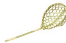
㉓竹 とうじそば用麺スクイ 15-130