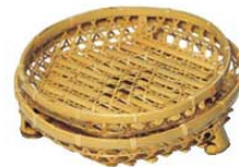
⑬白竹 オードブル皿 (足付)