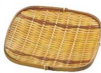
⑤竹 盛皿 20-115