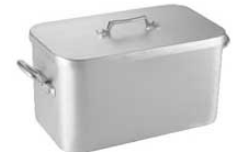
⑩ ムヴィエール アルミ プレザール 1111