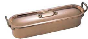
⑬ ムヴィエール 銅 ボワンソエ 2160