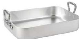
⑨ ムヴィエール アルミ ロティール 1113