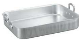
④ アルミ 浅型 ローストテンパン

Check! ローストパン・ロティールの用途、使用方法 西洋料理に使われ、ロースト(蒸し焼き)する、ボイルする、オーブンで焼く、大量食材の下ごしらえ、角型なので大容量の調理に適しています。大きい食材を切らずにそのまま調理できるのも利点の1つです。深型にスノコを合わせれば、蒸してそのまま取り出せます。