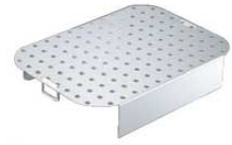
⑦ アルミ 深型 ローストテンパン用 スノコ