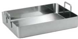
① デバイヤー イノックス ローストパン 3121