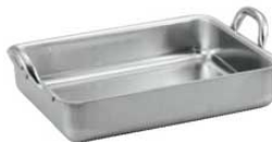
③ マトファー / ブウジャ 18-10 手付 ローストパン 7135