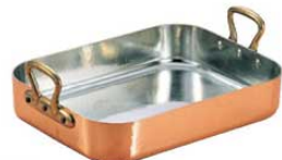
⑪ ムヴィエール 銅 ロティール 2155