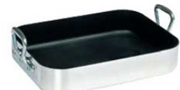
⑧ ムヴィエール シルバーストーン ロティール 9850