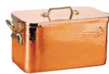
⑫ ムヴィエール 銅 プレザール 2153