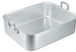
⑤ アルミ 深型 ローストテンパン