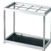
③ EBM 18-8 レインスタンド 8本立 MS-8U 3493900 ¥75,000 外寸:556×300×H460