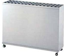
① EBM 18-8 レインスタンド (鍵付) 45本立 M-45K 3493600 ¥715,000 外寸:1,200×350×H940 キャスター/φ55(自在×4・2輪スッパ付)