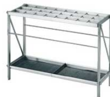
⑥ EBM 18-8 折りたたみ式 レインスタンド 24本立 3494200 ¥83,000 外寸:730×260×H510