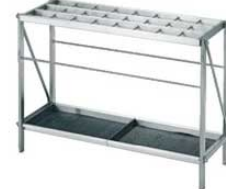
⑥ EBM 18-8 折りたたみ式 レインスタンド 24本立 3494200 ¥83,000 外寸:730×260×H510