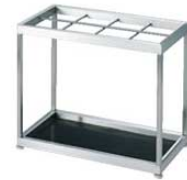
③ EBM 18-8 レインスタンド 8本立 MS-8U 3493900 ¥75,000 外寸:556×300×H460