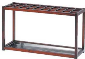
⑫ 木製カサ立て ケヤキ色 外寸 商品コード 価格 15本立 450×300×H500 1158100 ¥94,000 30本立 900×300×H500 1158200 ¥97,200 材質:スプルース・ステンレス