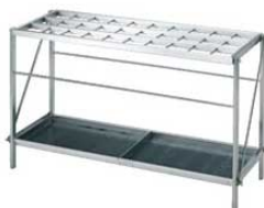
⑤ EBM 18-8 折りたたみ式 レインスタンド 30本立 3494100 ¥104,000 外寸:860×320×H510