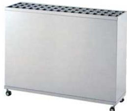
① EBM 18-8 レインスタンド (鍵付) 45本立 M-45K 3493600 ¥715,000 外寸:1,200×350×H940 キャスター/φ55(自在×4・2輪スッパ付)