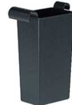
⑭ 折りたたみ傘用ポケット (2個セット) UP-1 外寸 重量 商品コード 価格 80×161×H217.5 166g 1539290 ¥2,300 材質:再生ABS樹脂 ●アンブレラスタンドに取り付けて使う折りたたみ傘用のポケット ●専用