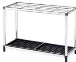
⑬ アンブレラスタンド 外寸 重量 商品コード 価格 24本立 400×300×H495 3kg 1539270 ¥23,000 48本立 750×300×H495 6kg 1539280 ¥32,000 材質:本体/ステンレスクラッド管 水受皿/再生ABS樹脂 付属品:水受皿