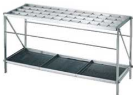
④ EBM 18-8 折りたたみ式 レインスタンド 48本立 3494000 ¥115,500 外寸:1,000×360×H510