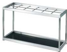
② EBM 18-8 レインスタンド 12本立 MS-12U 3493800 ¥92,400 外寸:812×300×H460