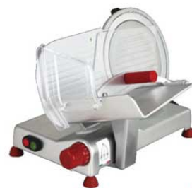
③フードスライサー D-25R

6410600 ¥385,000 外寸:655×620×H490 電源:単相100V (50/60Hz) 248W 定格時間:40分 厚さ調整:1~13mm 重量:29kg 切断有効寸法:①150 ②220 ③330 作動方式:手動式 能力:1,000~1,500枚/h 用途:ハム、ベーコン、すぎ焼き、しゃぶしゃぶ(半冷凍)、野菜、タン