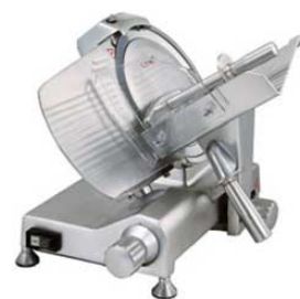
⑥フードスライサー EN-250

6410400 ¥163,000 外寸:500×424×H440 電源:単相100V (50/60Hz) 60/74W 定格時間:15分 厚さ調整:1~13mm 重量:16kg 切断有効寸法:①150 ②230 ③150 作動方式:手動式 用途:ハム、ソーセージ、しゃぶしゃぶ(半冷凍)、野菜 ●コンパクト設計の卓上型 ●耐酸化、耐塩構造 ●刃物交換・掃除が容易 ●便利な研磨装置付