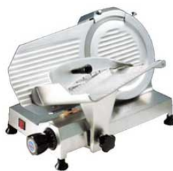
⑤ミートスライサー MS25MB

6936300 ¥248,000 外寸:590×515×H395 電源:単相100V (50/60Hz) 93/107W 定格時間:15分 厚さ調整:1~13mm 重量:23kg 切断有効寸法:①190 ②240 ③190 作動方式:手動式 用途:ハム、ソーセージ、しゃぶしゃぶ(半冷凍)、野菜 ●コンパクト設計の卓上型 ●耐酸化、耐塩構造 ●刃物交換・掃除が容易 ●便利な研磨装置付