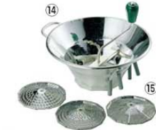
⑭LT スズメッキ ムーラン S3 31cm