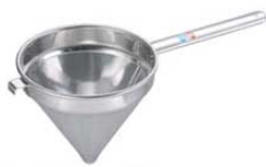
④UK 18-8 スープ漉