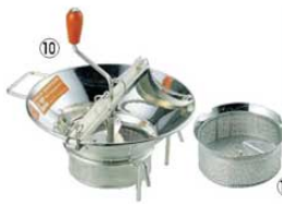
⑩LT スズメッキ ムーラン M515 37cm