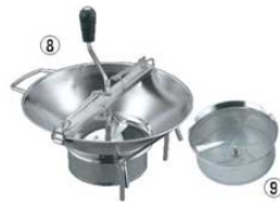
⑧LT 18-10 ムーラン X515 37cm