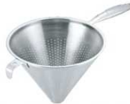
⑥UK 18-8 片手コランダー (モナカハンドル)