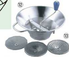
⑫LT 18-10 ムーラン 31cm