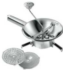
⑯LT 18-10 ムーラン N3004 24cm