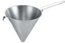
①デバイヤー 18-10 シノア 極細目