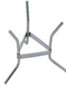
②デバイヤー シノア スタンド 3354-01