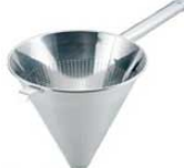
⑤UK 18-8 パンチング スープ漉