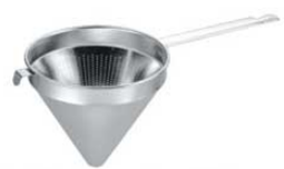
⑦メロディ 18-8 スープ漉