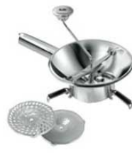
⑰LT 18-10 ムーラン N3002 20cm