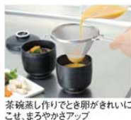
茶碗蒸し作りでとき卵がきれいにごせ、まろやかさアップ