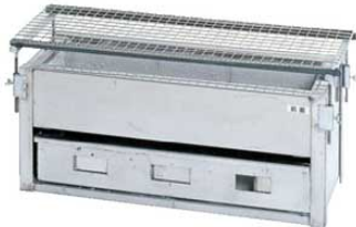
①IT やきとりコンロ 炭火焼