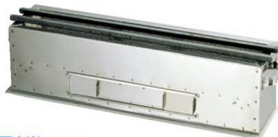
②抗火石木炭コンロ