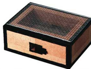
④炭用バーベキューコンロ BQ-12号 (4~8人用)

0263900 ¥13,000 外寸:310×230×H210 内寸:230×150×H110 重量:6.5kg 付属品:焼アミ1枚 材質:珪藻土