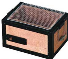
③炭用バーベキューコンロ BQ-8F号 (2~4人用)

0263900 ¥13,000 外寸:310×230×H210 内寸:230×150×H110 重量:6.5kg 付属品:焼アミ1枚 材質:珪藻土