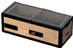
⑤炭用バーベキューコンロ BQ8WF号 (4~8人用)

6559500 ¥19,000 外寸:540×230×H200 内寸:460×150×H110 重量:10kg 付属品:焼アミ2枚 材質:珪藻土