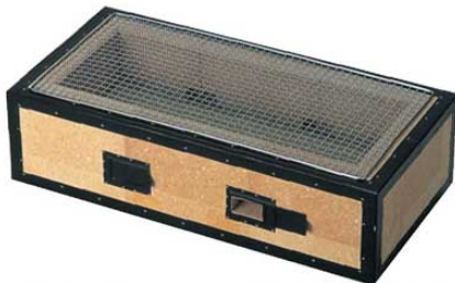
⑦炭用バーベキューコンロ BQ17号 (6~12人用)

6559800 ¥32,000 外寸:700×350×H210 内寸:580×230×H110 重量:22kg 付属品:焼アミ1枚 材質:珪藻土