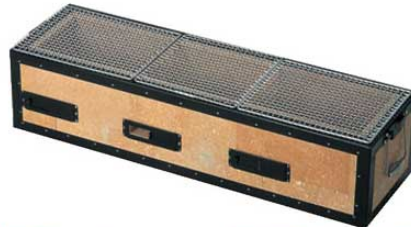
⑥炭用バーベキューコンロ BQ8T号 (6~12人用)

6559500 ¥19,000 外寸:540×230×H200 内寸:460×150×H110 重量:10kg 付属品:焼アミ2枚 材質:珪藻土