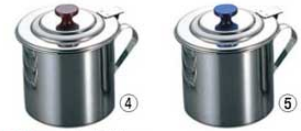
EBM モリブデン 蝶番付ソースポット 外寸 ④赤 ⑤青 価格 10cm φ100×100 0038500 0038510 ¥3,900 12cm φ120×120 0038600 0038610 ¥4,600