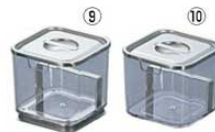
⑨UK ポリカーボネイト 角タレ入 台付 0511200 ¥2,950 外寸:95×95×H90