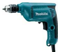
㉗マキタ 電動式ドリル 6412 型 4911600 ¥11,900 電源:単相100V/450W 定格電流:47A コード長さ2m チャック範囲:1.5mm~10mm 重量:1.2kg