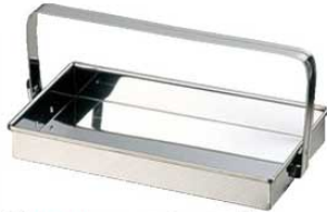
①EBM 18-0 お好み岡持ち 1074300 ¥2,500 外寸:310×170 内寸:300×160×H40

49 タイマー 50 濃度計他 51 炊飯器・スプージャー 52 電気・ガスコンロ 53 焼アミ 54 オーブン・電子レンジ 55 低温調理器・フードウォーマー 56 お好み焼・たこ焼・鉄板焼肉