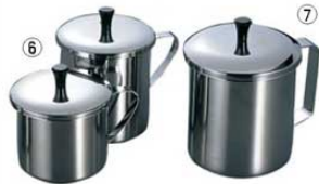
⑥モリブデン ソースポット 外寸 商品コード 価格 大 φ102×108 6916100 ¥3,100 小 φ95×85 1074900 ¥1,900