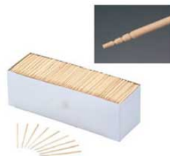
㉔たこ焼楊枝 1kg 8226400 ¥2,400 外寸:φ2.5×80 (1kg 約3,800本入) 材質:白樺 ●たこ焼が取りやすいように先にすべり止めが付いています。