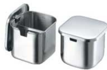
⑧クローバー モリブデン プレス 角タレ入 0511100 ¥2,340 外寸:95×95×H85 容量:0.5ℓ ●蓋の裏に引掛金具が付いているので、蓋の置き場所に困りません。 ●タレ切り付で便利です。