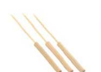
㉓竹たこ焼ピック (100本入) 8226300 ¥2,500 全長:170