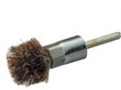
㉖ワイヤーボタン タコ焼きブラシ (ドリル用) 5209700 ¥2,100 全長:φ32×H95 (真鍮毛)