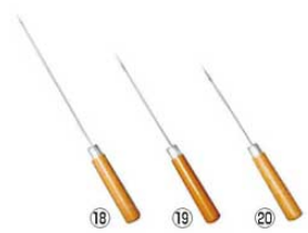
先丸千枚通し 全長 商品コード 価格 ⑱大 TS-160 290 6794400 ¥560 ⑲中 TS-161 240 6794500 ¥530 ⑳小 TS-162 215 6794600 ¥500 ●鉄板などの表面をキズつけにくい先丸加工