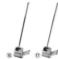
EBM 18-8 ウナギタレカケ 商品コード 価格 ⑯3本口 4819400 ¥1,600 ⑰4本口 4819500 ¥1,850 容量:40cc 全長:270