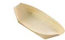
㉕経木舟皿 (50枚入) 外寸 商品コード 価格 7寸 約190×100 5582900 ¥900 8寸 約215×107 5582910 ¥1,100 9寸 約250×120 5582920 ¥1,300