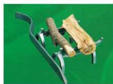
図のように使用するとより効果的です。