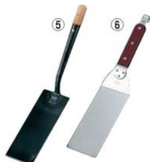
⑤EBM 鉄 ギョーザ返し