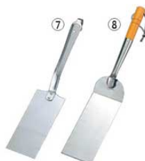
⑦UK 18-8 ギョーザ返し