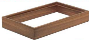
④ ブラウン 9377910 530×325×H80 4062700 ¥26,200