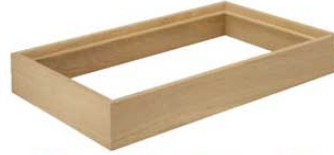
⑥ ナチュラル 9377912 530×325×H80 4062850 ¥20,400

Check! P919-②メラミン ガストロノームパンの1/1・2/4・1/2・1/3・2/3(2/3が1枚と1/3が1枚の組み合わせ)もご使用いただけます。高さ100mmは木枠を2段以上にスタッキングしてご使用ください。