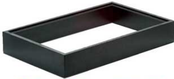
⑤ ダークブラウン 9377911 530×325×H80 4062800 ¥24,500