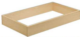
⑦ スタッキング用木枠 9377940 505×300×H72 4063300 ¥11,800

Check! P919-②メラミン ガストロノームパンの1/1・2/4・1/2・1/3・2/3(2/3が1枚と1/3が1枚の組み合わせ)もご使用いただけます。高さ100mmは木枠を2段以上にスタッキングしてご使用ください。