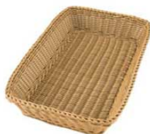
④ 角バスケット 1/1サイズ ベージュ 530×320×H100 2329610 ¥7,000 材質:ポリプロピレン

焼きたてのパンが選べるビュッフェ。そんな差別化がしたくなるバスケットです。 シナリオ バスケット(PP)