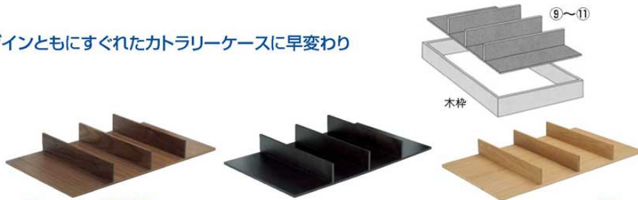
ビュッフェ用仕切板 ⑨ ブラウン 9377920 503×298×H57 4062900 ¥19,400 ⑩ ダークブラウン 9377921 503×298×H57 4063000 ¥19,400 ⑪ ナチュラル 9377922 503×298×H57 4063050 ¥15,600