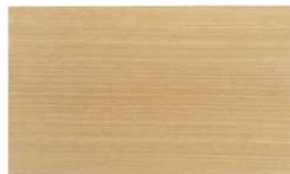
③ ナチュラル 9377932 503×298×H10 4063250 製造中止