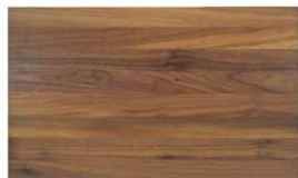
① ブラウン 9377930 503×298×H10 4063100 ¥9,100