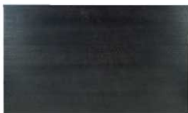
② ダークブラウン 9377931 503×298×H10 4063200 ¥7,400