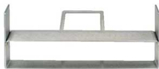
木枠用スタンド 全高 商品コード 価格 ⑦ 小 9377960 330×50×H48 110 4063500 ¥13,400 ⑧ 大 9377961 540×50×H48 110 4063600 ¥15,300 材質:ステンレス