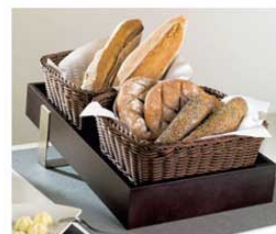
写真は木枠1/1・中板1/1・バスケット大×2・スタンド小の組み合わせです。バスケット小×4の組み合わせ、バスケット大×1・小×2の組み合わせも可能です。