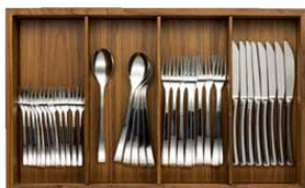
写真は木枠・仕切板の組み合わせにカトラリーを収納したものです。