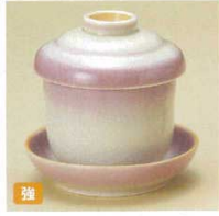
18011-578 紫吹小むし碗 1,150円 100入 (6.9×8.5cm・175cc)