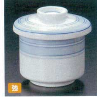
18032-578 駒筋小むし碗 980円 80入 (6.7×7.8cm・150cc)