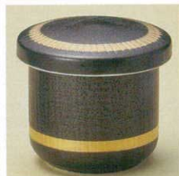
18019-318 錦糸線ミニむし碗 1,100円 20×5入 (7.5×6.4cm・130cc)