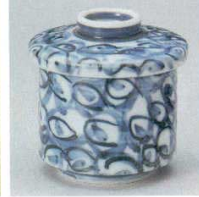
18031-558 水泡むし碗 1,000円 80入 (7.2×8.5cm・160cc)