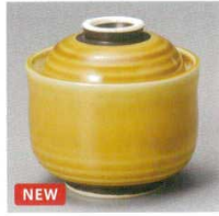
NEW 18010-578 黄瀬戸一口碗 1,150円 90入 (8.3×8.2cm・130cc)