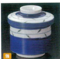
18001-558 花つなぎむし碗 1,260円 80入 (6.7×8cm・150cc)