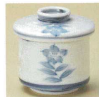
18033-558 桔梗むし碗 950円 80入 (7.2×8.5cm・160cc)