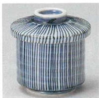
18003-558 千筋十草むし碗 1,250円 80入 (7.2×8.5cm・160cc)