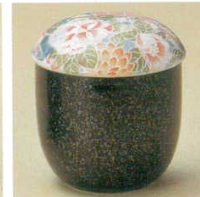
18036-238 青花丸小むし 830円 75入 (7×8cm・160cc)