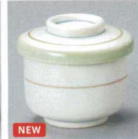
NEW 18038-548 葵むし碗 960円 80入 (8×8.5cm・250cc)