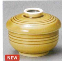
NEW 18023-578 黄瀬戸ラインミニ蒸し 1,100円 100入 (7×6cm・85cc)