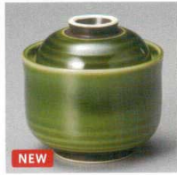
NEW 18009-578 織部一口碗 1,150円 90入 (8.3×8.2cm・130cc)