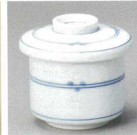
18037-558 点紋むし碗 820円 80入 (7×8cm・160cc)