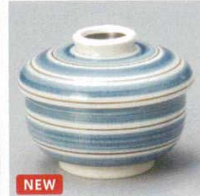
NEW 18024-578 太駒筋ミニ蒸碗(青) 1,100円 120入 (7×6cm・85cc)