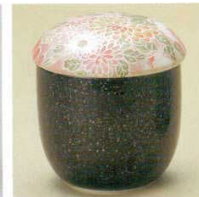
18035-238 赤花丸小むし 830円 75入 (7×8cm・160cc)