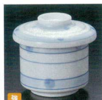
18016-558 ダミラインむし碗 1,100円 80入 (6.8×7.8cm・170cc)