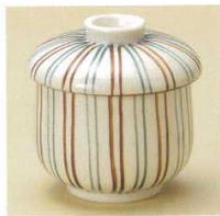
18007-578 二色十草小むし碗 1,180円 80入 (6.7×8cm・130cc)