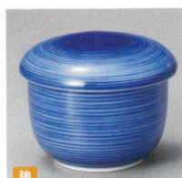
18015-558 呉須巻丸むし碗 1,130円 80入 (7.5×6.5cm・150cc)