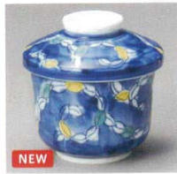
NEW 18008-548 木の葉つなぎむし碗 1,180円 80入 (7.3×8.6cm・180cc)