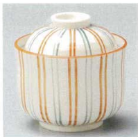
18005-578 二色十草一口碗 1,200円 80入 (8.3×8.2cm・130cc)