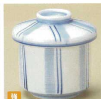
18017-558 親子十草むし碗 1,100円 80入 (6.8×7.8cm・150cc)