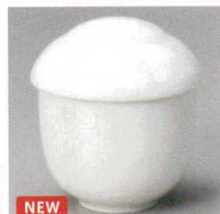
NEW 18018-248 白むし碗(小) 1,100円 60入 (7.5×8cm・143cc)