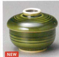
NEW 18022-578 織部ラインミニ蒸し 1,100円 100入 (7×6cm・85cc)