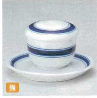
18013-558 駒筋丸むし碗 1,130円 80入 (7.5×6.5cm・150cc)