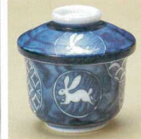
18028-548 京祥瑞むし碗(小) 1,100円 80入 (7.5×8.2cm・180cc)