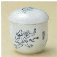
18006-468 鳥獣戯画むし碗 1,300円 100入 (7×8cm・160cc)