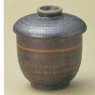
18026-548 黒鉄砂むし碗(小) 1,050円 80入 (6.6×8cm・140cc)