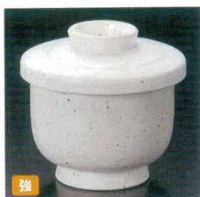
18002-558 白マット袖むし碗 1,260円 80入 (6.5×7.2cm・110cc)