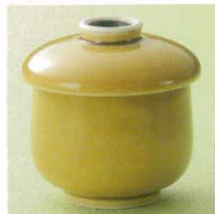
18020-578 黄瀬戸小むし碗 700円 100入 (13.5×1.8cm)