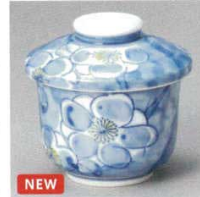
NEW 18027-578 やり梅小むし碗 1,050円 80入 (7.3×8.5cm・180cc)