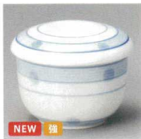
NEW 18004-558 ダミライン丸型むし碗 1,220円 60入 (7.4×6.8cm・150cc)