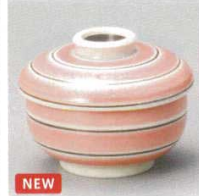
NEW 18025-578 太駒筋ミニ蒸碗(赤) 1,100円 120入 (7×6cm・85cc)