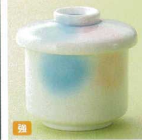
18030-578 水玉小むし 1,000円 80入 (7×7.5cm・140cc)