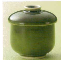
18021-578 織部小むし碗 1,100円 80入 (6.7×8.2cm・150cc)