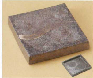
25203-668 黒窯変クシ目6.8角皿 (両面使用可) (信楽焼) 5,000円 24入 (20.5×20.5×3cm)