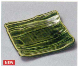
NEW 25208-578 たたら総織部正角皿 3,300円 30入 (20.5×19×2.5cm)