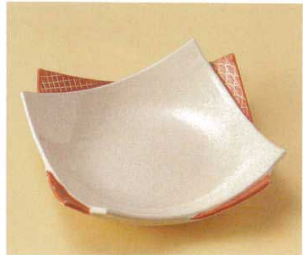
25204-588 赤絵重ね皿 (大) 4,110円 40入 (20.4×20.4×5.8cm)