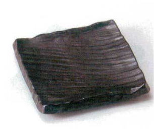
25219-138 備前黒荒彫角皿 (大) 1,950円 20入 (20×20×3.1cm) 25220-138 備前黒荒彫角皿 (小) 1,200円 36入 (15.5×15.5×3.2cm)