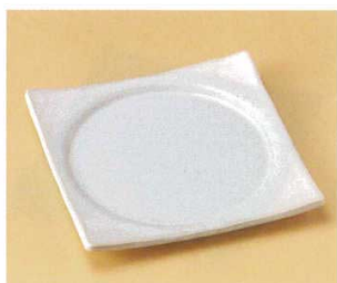
25216-188 白釉正角盛皿 2,000円 20入 (20.8×20.8×2.3cm)