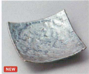
NEW 25201-668 銀袖6.0角皿 (信楽焼) 5,500円 24入 (19.5×19.5×5cm)