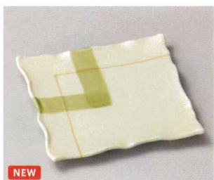
NEW 25213-588 重ね格子正角皿 2,190円 60入 (20×20×2.6cm)