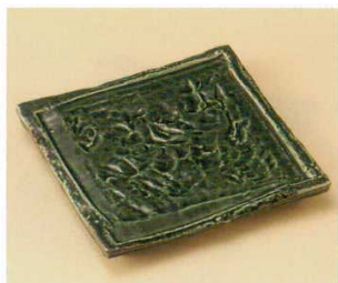
25210-148 織部四足正角皿 2,980円 30入 (20.5×20.5×2cm)