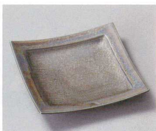
25214-298 虹彩千段角皿 (大) 2,050円 50入 (20.4×3.6cm)