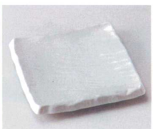
25217-138 白マット荒彫角皿 (大) 1,950円 20入 (20×20×3.1cm)