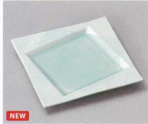
NEW 25202-298 青白磁スクエアプレート 19cm 5,400円 30入 (19.2×19.2×2.4cm)