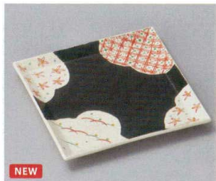
NEW 25207-578 黒格子角大皿 3,400円 30入 (20.5×20.5×2cm)