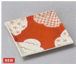
NEW 25206-578 赤格子角大皿 3,400円 30入 (20.5×20.5×2cm)