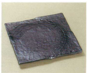
25212-318 ゴーカイ黒 (小) 正角皿 2,590円 30入 (19.2×19.2×2cm)