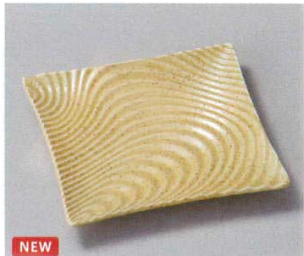
NEW 25223-138 砂丘風紋正角皿 (大) 1,550円 30入 (19.8×19.8×2.5cm) 25224-138 砂丘風紋正角皿 (小) 1,150円 60入 (16.6×16.6×2cm)