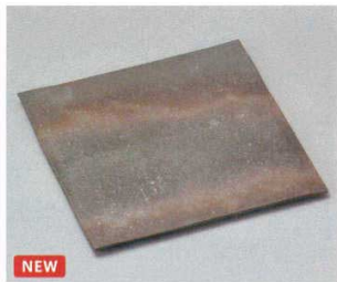
NEW 25205-668 炭化6.6角皿 (信楽焼) 3,950円 20入 (19.8×19.8×1cm)