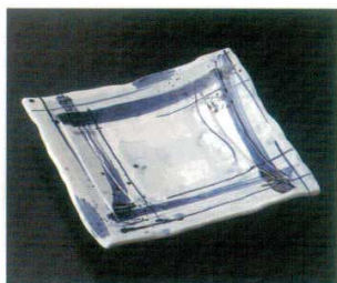
25211-178 呉須格子長角6.5皿 2,800円 30入 (20.4×20×3cm)