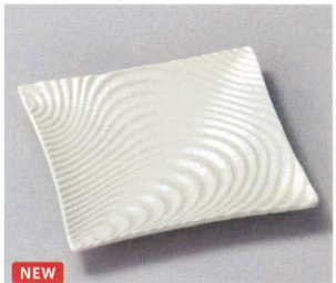
NEW 25225-138 粉引釉風紋正角皿 (大) 1,550円 30入 (19.8×19.8×2.5cm) 25226-138 粉引釉風紋正角皿 (小) 1,150円 60入 (16.6×16.6×2cm)