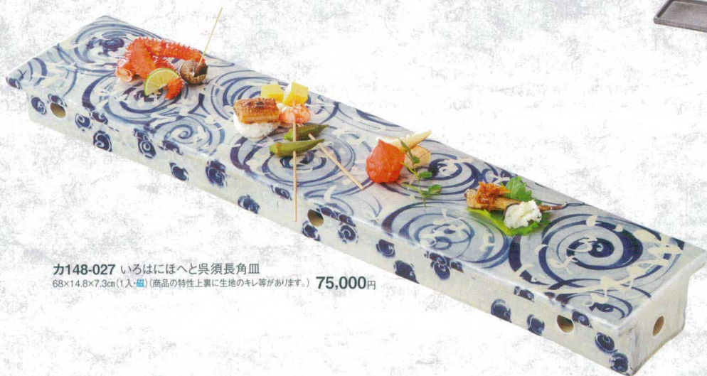
カ148-027 いろはにほへと呉須長角皿 68×14.8×7.3cm(1入・磁)(商品の特性上裏に生地のキレ等があります。) 75,000円