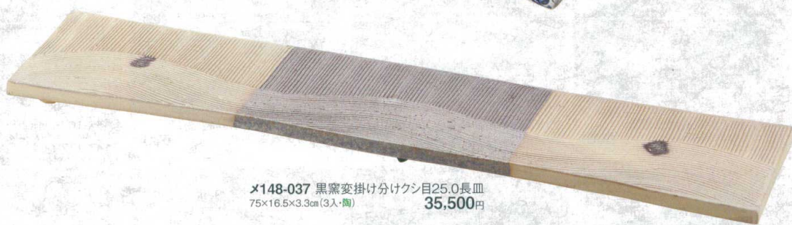
×148-037 黒窯変掛け分けクシ目25.0長皿 75×16.5×3.3cm(3入・陶) 35,500円