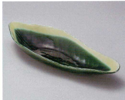
ミ162-087 和匠木の葉型盛鉢 43×18×6.5cm (20入・磁) 3,250円