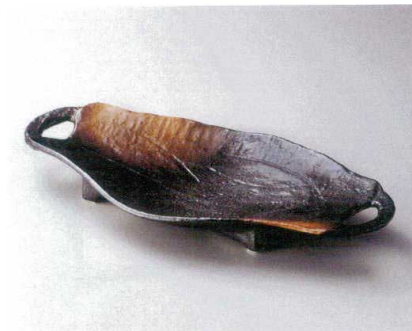
ヤ162-047 黒備前金茶吹き手付盛鉢大 40×20.5×4cm (20入・磁) 4,400円