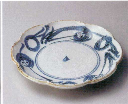
テ162-097 波唐草8.5皿 26cm (20入・磁) 3,900円 テ162-107 波唐草7.0皿 23cm (30入・磁) 3,050円