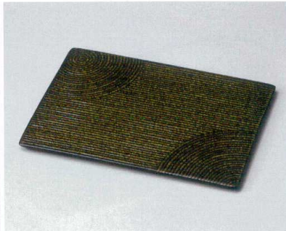
タ162-027 苔山水28cm平長角皿 28.5×20.3×1cm (12入・磁) 5,200円