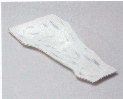
ミ162-017 炭化土粉引 木目 13.0皿 40.5×20×1.6cm (20入・陶) 5,900円