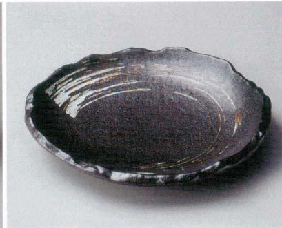
イ162-137 栗色刷毛目たたき大皿 φ27×4.5cm (20入・磁) 3,500円