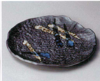
ヤ162-067 黒三彩変型丸大皿 φ31.5cm (20入・磁) 4,400円