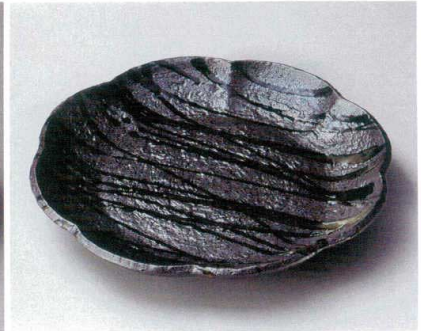
ツ162-117 黒織部流し8.5花型皿 26.5×3.8cm (20入・磁) 3,450円