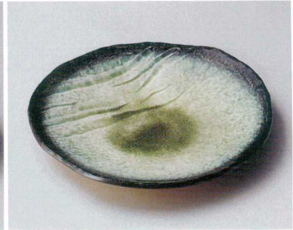
ホ162-147 藍染グリーン9.0丸皿 φ27.5×3.5cm (30入・磁) 2,250円