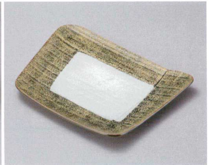
ミ162-077 織部金タタキ変形大皿 30.2×24×2.7cm (30入・磁) 4,150円