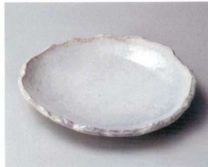
イ162-127 うのふ 蕨変たたき大皿 φ27×4.5cm (20入・磁) 3,500円